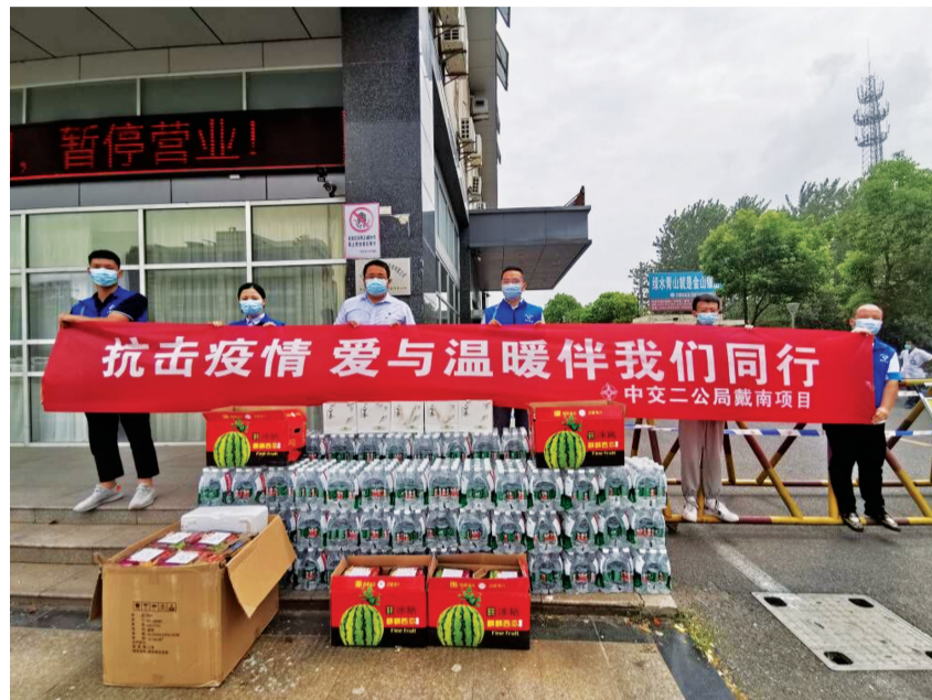
爱心企业捐赠物品。

“根据防疫需要,上级统一安排67位扬州市民来我镇进行医学观察。自古扬泰一家亲。我们戴南人理应发扬一方有难、八方支援的友爱精神,全力服务好这批特殊的客人,把他们当着戴南人的亲和友……”在8月11日召开的兴化市戴南镇全员核酸检测工作部署会上,市委常委、戴南镇党委书记夏爱东带着