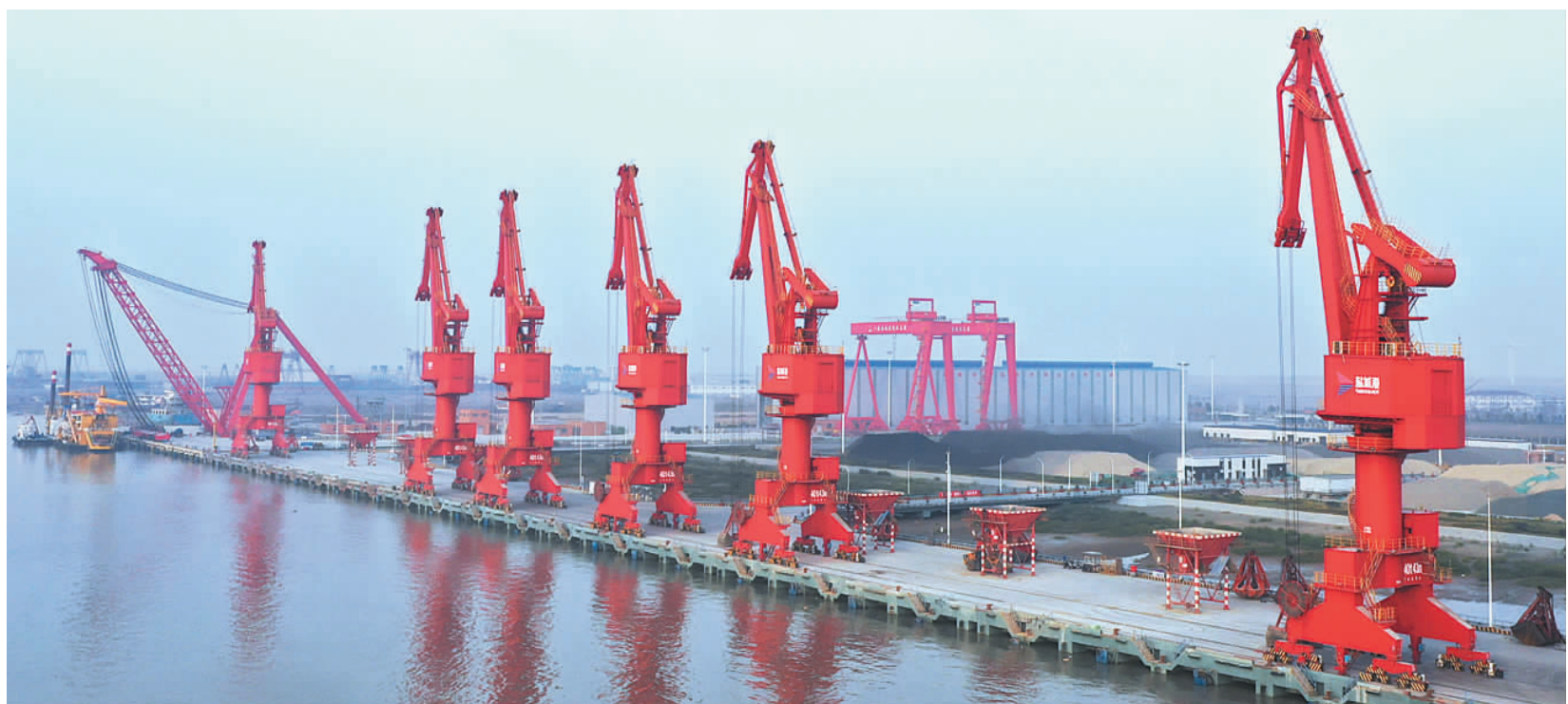
当前,我县抢抓绿色转型大势风口,坚持高起点谋划,把陈家港片区作为黄海新区发展的头号工程、头等大事,举全县之力、聚全县之智,坚持港口、港产、港城“三港联动”,更高站位、更高标准、更实举措,全速推进片区建设。图为响水港区一角。

郭超强调,要坚持以人民为中心,把“人民城市人民建,人民城市为人民”重要理念贯彻落实到城建城管工作全过程,以打造“宜居宜业幸福小城”为目标定位,高品质建设、高效率改造、高标准管理,进一步提升城市“温度”和舒适度,不断增强人民群众获得感和幸福感。要坚持“整体向南、局部向东”的城市框架布局,迅速思考研究2022年城建城管工作计划,聚焦骨干道路改造提升、老旧小区改造、棚户区改造、黑臭水体整治等重点,抓紧编排具体项目。要以全国文明城市和国家卫生城市创建为抓手,按照精细化管理要求,下足“绣花”功夫,进一步提升城市管理水平。各镇区和相关部门单位要加强协同配合,形成强大工作合力,切实把城市建设好、管理好、运营好。