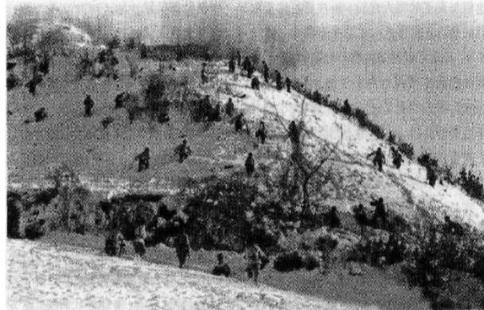
图为抗美援朝战争中的排进攻战斗队形

总的来说,“三三制”既可用于进攻,也可用于防御,是一种普适性较强的“自我防御机制”。它不仅在过去发挥了重要的作用,在未来无人集群作战中,相信同样能够发挥重要的战术价值。