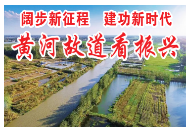
阔步新征程 建功新时代 黄河故道看振兴

水稳摊铺18公里等，占总工程量的60%左右，预计在10月份全线贯通，建成后实现黄河故道片区沿线镇区的东西连接，构建起八园同创的富民廊道。