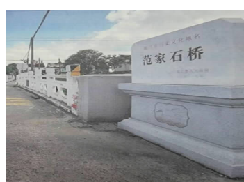
座水泥桥的西侧便是原范家石桥的旧址。范家石桥是一座有着两百六十多年悠久历史，同时又镌刻着红色印记的桥。它见证了苏北人民游击抗日第一枪。

一走进江苏省靖江市孤山镇石桥村，远远可见一座南北向的水泥桥，桥头一块“靖江历史文化地名”碑，上书“范家石桥”四个大字，桥身还刻有红色的“石桥”二字。这