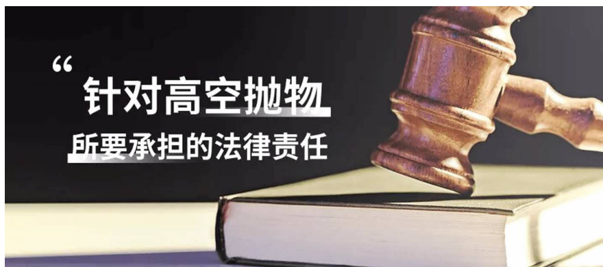
“针对高空抛物所要承担的法律法律责任”