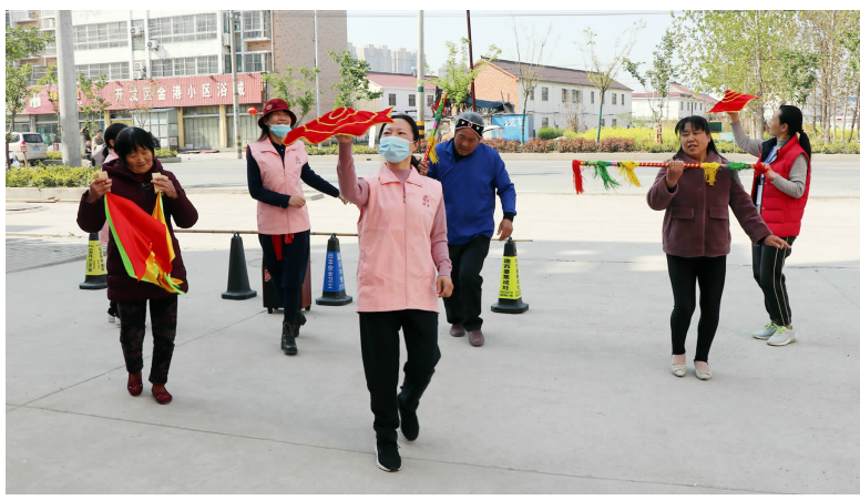
县妇联带领居民扭秧歌做文明风尚传播者