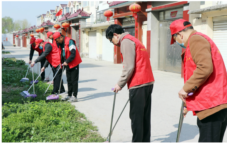
县总工会工作人员清除包干区垃圾