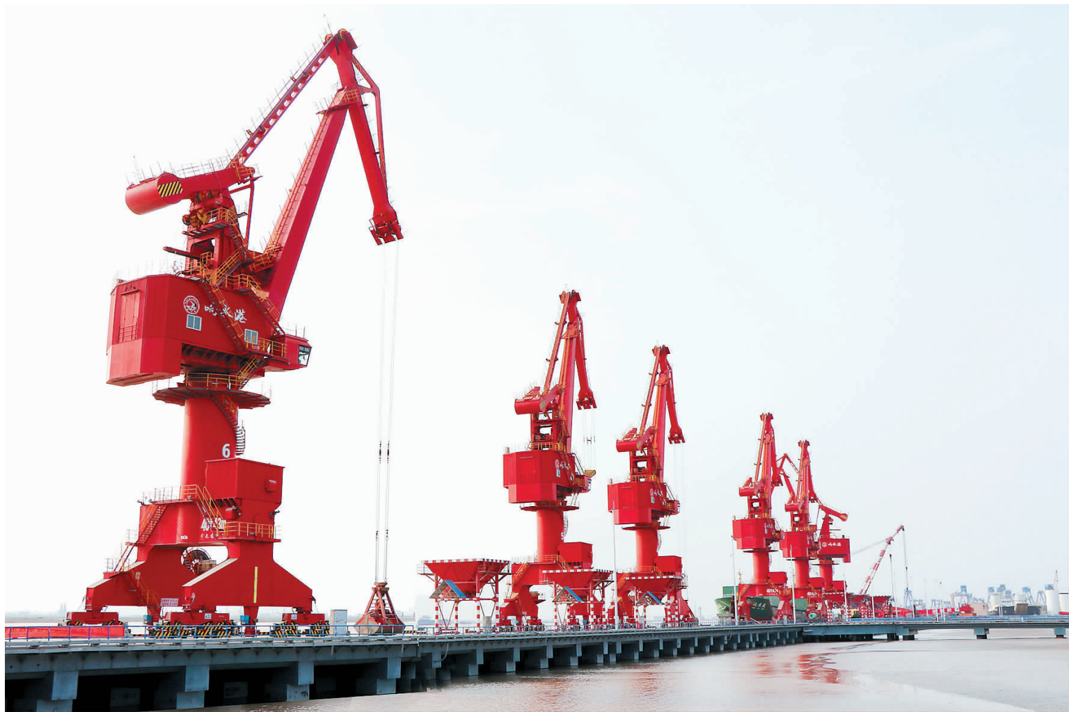
我县抢抓国家沿海开发和长三角一体化等发展战略机遇，充分发挥依河傍海的资源优势，大力推动响水港向规模化、国际化、智能化的海河联运亿吨特色大港迈进。图为5月19日，记者拍摄的响水港一角。

会议还学习传达了省市政协相关文件精神。会前，与会人员还参观了经济开发区、响水镇“有事好商量”协商议事工作现场。