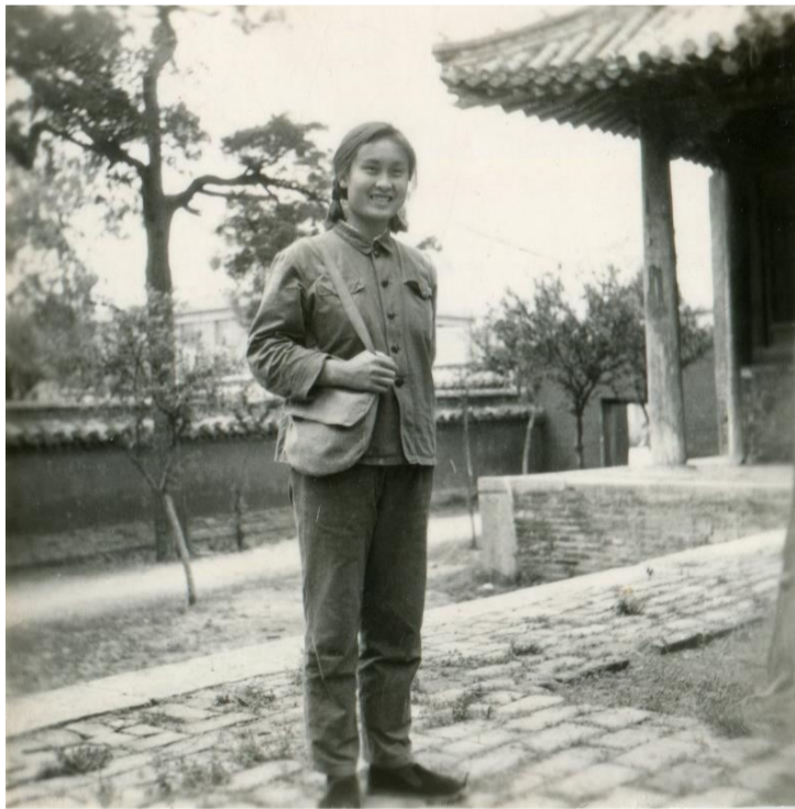
上图:陈子江院士展示题词 右图:陈子江院士在孟庙旧影

得“山东省科学技术最高奖”“国家科技进步奖”“全国创新争先奖”“五一”劳动奖章等多项荣誉。2019年11月,陈子江当选中国科学院院士。她注重青年人才培养,获评全国优秀博士学位论文指导教师,先后培养出泰山学者特聘教授3人、国家级青年人才3人、泰山学者青年专家7人、山东大学齐鲁青年学者4人、未来青年学者7人。 “邹城是我的第二故乡,在那里我度过了人生中最美好的一段时光。”和昔日的校友共同回忆起在邹学习、生活的那段岁月,陈子江院士深情满满、感慨万千。临别时,她欣然应邀,提笔写下“感恩母校”四字题词,以表达对母校瓷矿一中、对第二故乡邹城的眷恋之情。