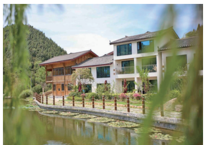
大盛镇廖家湾民宿