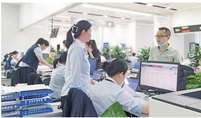
区市场监管局工作人员向咨询个体工商户政策的市民介绍相关情况

区市场监管局相关负责人告诉记者,近年来,为扶持个体工商户发展壮大,我区坚持问题导向,以帮助个体工商户纾困解难为着力点,持续用力、靶向施策,积极破解个体工商户发展中的难点堵点痛点问题。