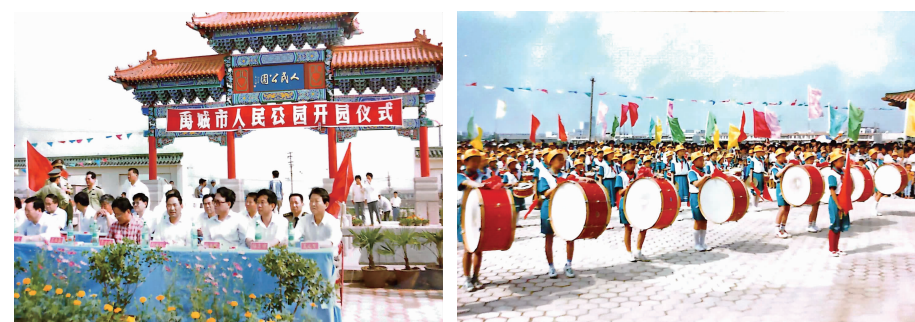
1996年6月1日市人民公园正式对外开放