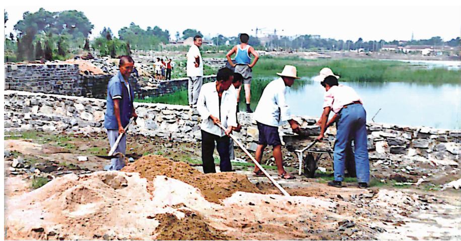
1995年春人民公园开工建设

建有“九龙入海”“禹”字文化景墙、亲水平台、九曲桥、“一步两眼井”等23处景观，大禹主题广场、戏迷广场、健身广场等16处休闲场地。近年来，侧重满足群众健身休闲需求，相关部门不断对公园进行建设完善，不断迭代的户外建设器材、高标准的橡胶跑道等充分满足了群众的锻炼需求。