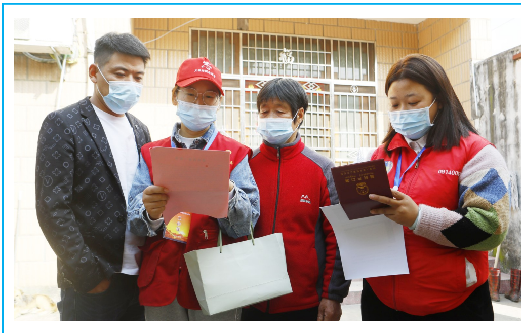
镜走盐都 JING ZOU YAN DU

党员干部聚焦农房一体发证、服务老旧小区加装电梯、农村集体经营性建设用地挂牌、全域土地综合整治等工作,深入镇区、企业和群众走访,排定为民办实事项目,积极破解群众“急难愁盼”问题,先后帮助解决御景湾花园小区办理不动产权证等80多件难题。