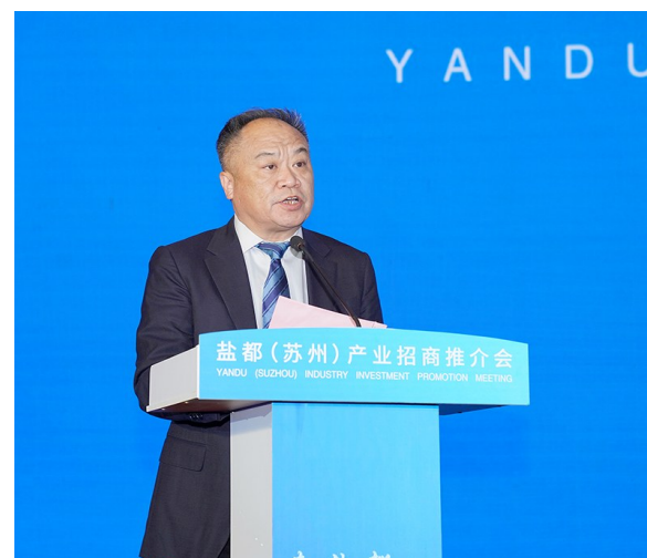
盐城高新区管委会主任高翔主持