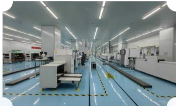
大因智能音视频项目