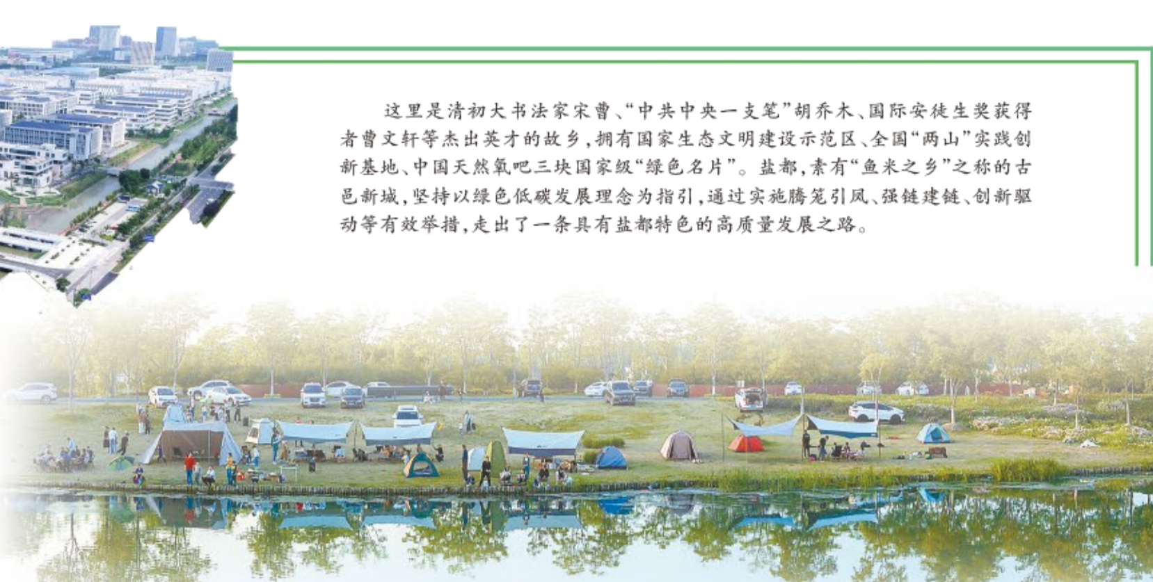
蟒蛇河水上文化生态廊道