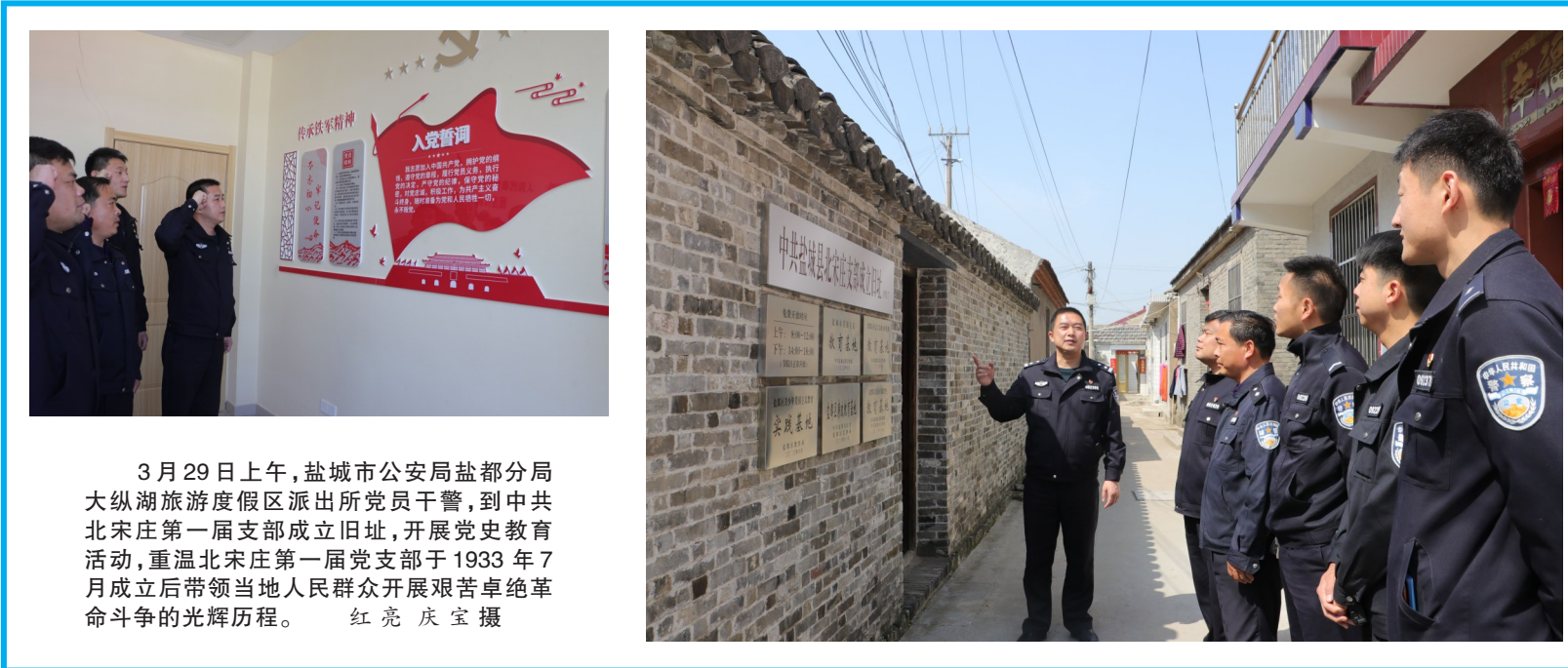
3月29日上午,盐城市公安局盐都分局大纵湖旅游度假区派出所党员干警,到中共北宋庄第一届支部成立旧址,开展党史学习教育,重温北宋庄第一届党支部于1933年7月成立后带领当地人民群众开展艰苦卓绝革命斗争的光辉历程。