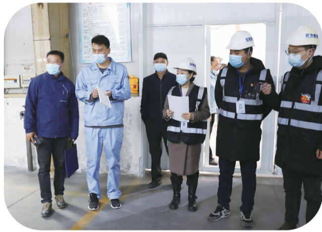
“三位一体”执法检查现场。

以赴抓好安全生产工作。通过开展“企业主要负责人履职”“工贸企业安全生产主体责任落实”“优化执法方式提升执法效能百日行动”等系列专项执