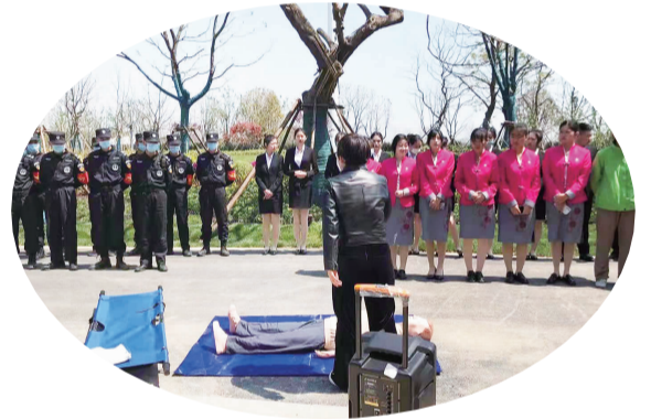
为世园会提供班前培训。

行政执法保障。为确保我市安全生产形势持续稳定,全面压降生产安全事故,切实保障人民群众生命财产安全,2021年,市应急管理局坚持以严执法与深服务并重,紧盯企业主要风险、重大隐患、易引发事故隐患扎实开展精准执法,全力