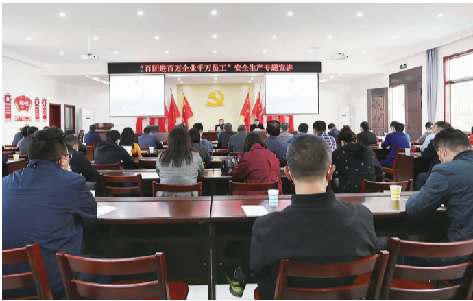
百团进百万企业宣讲。

及时警示提醒。为督促广大企业深刻吸取事故教训,举一反三提高安全管理水平,起到“一厂出事故、万厂受教育”的警示效果。2021年,市应急管理局针对每起事故,召开事故现场警示教育会,约谈同类型企业主要负责人;针对事故上升的园镇、部门,及时下发《警示提示函》;针对疫情防控、限电保供特殊时期,第一时间发布提示提醒,迅速遏制安全监管松懈苗头。