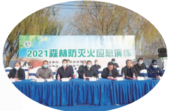
森林防灭火应急演练。

推进应急预案口袋化工作。牵头组织市级危化品生产安全事故综合应急演练、森林防灭火演练和工贸企业专项演练,参与指导各类演练443场次。物资储备逐渐充实。先后与发改委等部门对接,完善应急物资的监管、储备、调拨和紧急配送体系。切实摸清全市应急物资储备底数和储备规模。协调落实各类森林防灭火专业抢险设备162台(套)。发布预警和灾情信息8份,完成“4·30”“5·15”极端天气财产受损理赔。