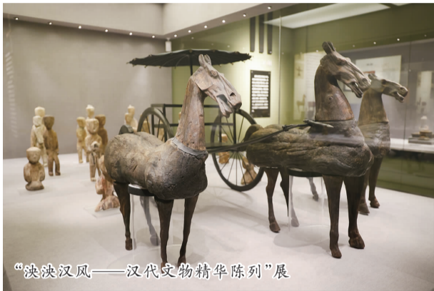
“泱泱汉风——汉代文物精华陈列”展

此外，捺山地质公园开发出地质、植物、昆虫三大学科十几个专题科普研学路线，每年吸引16万余人参与，累计已超过百万量级，让公众在更多参与和体验过程中，探知自然之谜，普及科学知识。