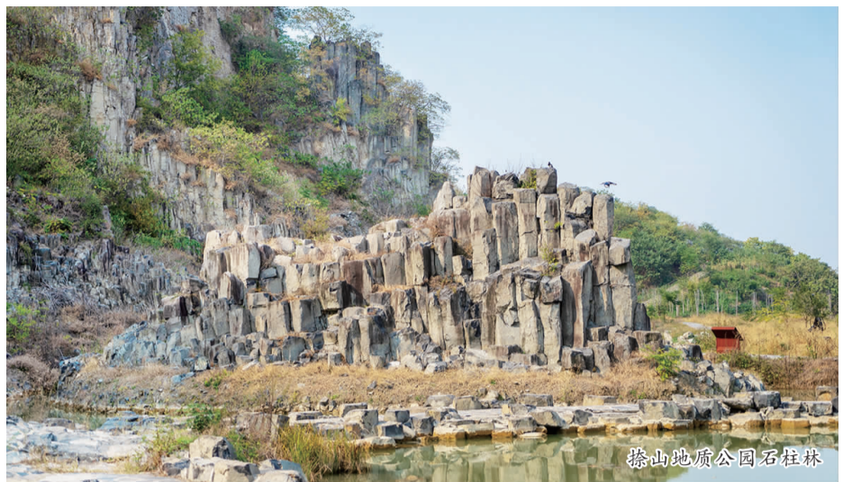
捺山地质公园石柱林