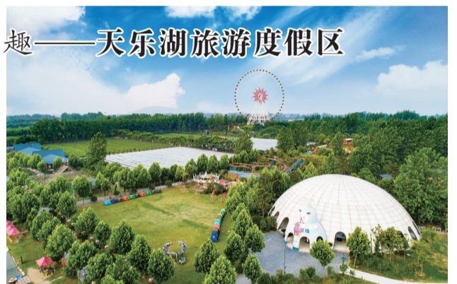
天乐湖旅游度假区

在这里，动静相宜皆成趣，不同年龄、不同兴趣的游客都能找到属于自己的欢乐。赏湖光美色，尽情畅玩四十多项游乐设施，让你放松娱乐两不误；泡天然温泉，富含30余种微量元素，配套28口园林泡池，让你头顶日月星辰，耳闻天籁之音，在慵懒惬意中舒缓放松；“趣”研学课堂，6大类50多门定制化课程，让旅行既有趣又有所获；湖景客房、有机菜肴，给你静谧闲适与营养健康。