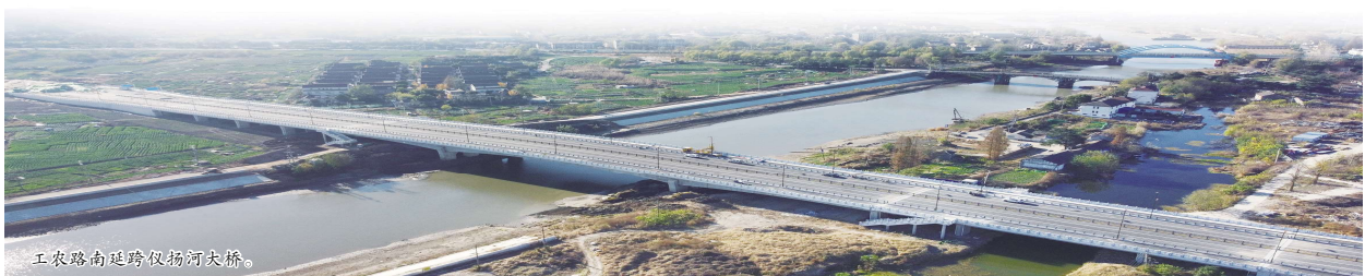
工农路南延跨仪扬河大桥。