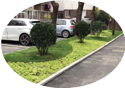
鼓楼西路98号小区改造。

解读: 突破制约,土地开发、工程建设等传统产业效能不断提升,一级开发方面,完成非住宅房屋清租工作60户,圆满实现房屋征收、资金兑付、安置签约等预期目标,优化完善胥浦产城融合区域环境功能,完成180户房屋搬迁,盘活存量用地。城市更新是工程建造产业的重头戏,工农路南延跨仪扬河大桥顺利通过验收并通车,完成红旗路西延、浦峰路拓宽改造、工农路管网综合改造、20个老旧小区改造等工程,汽车工业园一期绿化提升工程基本竣工,