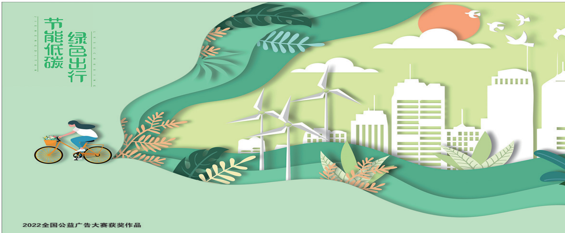
2022全国公益广告大赛获奖作品