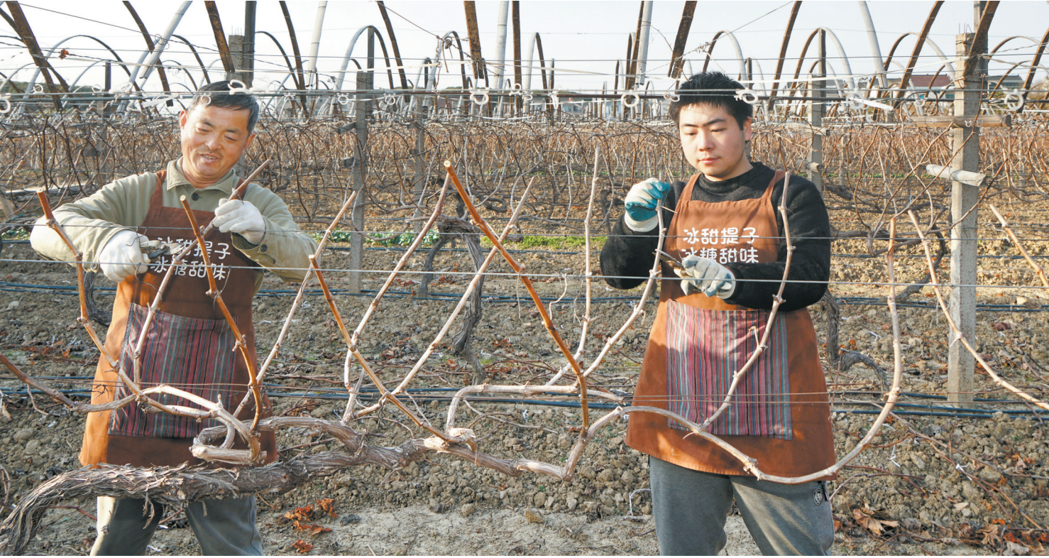
随着天气转冷,果树生长渐渐进入休眠期,冬季修剪提上果树栽培管理日程。图:宝岩冰糖葡萄种植基地的工作人员正在给葡萄树剪枝。

从县域银行的深耕细作到区域金融的协同发力,从单一金融服务到生态平台共建,此次大会是里程碑,更是新起点。苏州金融会客厅的启用不仅为苏州金融与产业融合搭建了实体平台,更构建起“党建引领、培训赋能、资源聚合、招商联动”的金融生态闭环。随着各类资源的持续汇入与合作的不断深化,这座矗立在沙家浜畔的金融新地标必将成为激活区域经济活力、推动普惠金融发展、培育金融专业人才的重要阵地,为常熟乃至长三角地区的高质量发展注入源源不断的金融动能。