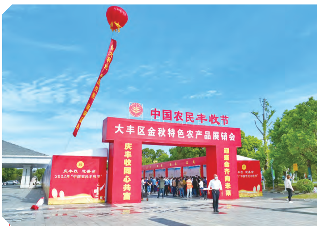
五谷丰登,瓜果飘香。9月23-24日,我区举办主题为“庆丰收同心共富、迎盛会齐向未来”系列活动,庆祝第五个“中国农民丰收节”。通过开展金秋农产品展销会、大丰农产品直播带货达人抖音短视频大赛、“送法送技术送政策”宣传、金秋采摘等系列,进一步拓宽大丰优质农产品的销售渠道,用丰收的硕果喜迎党的二十大胜利召开。