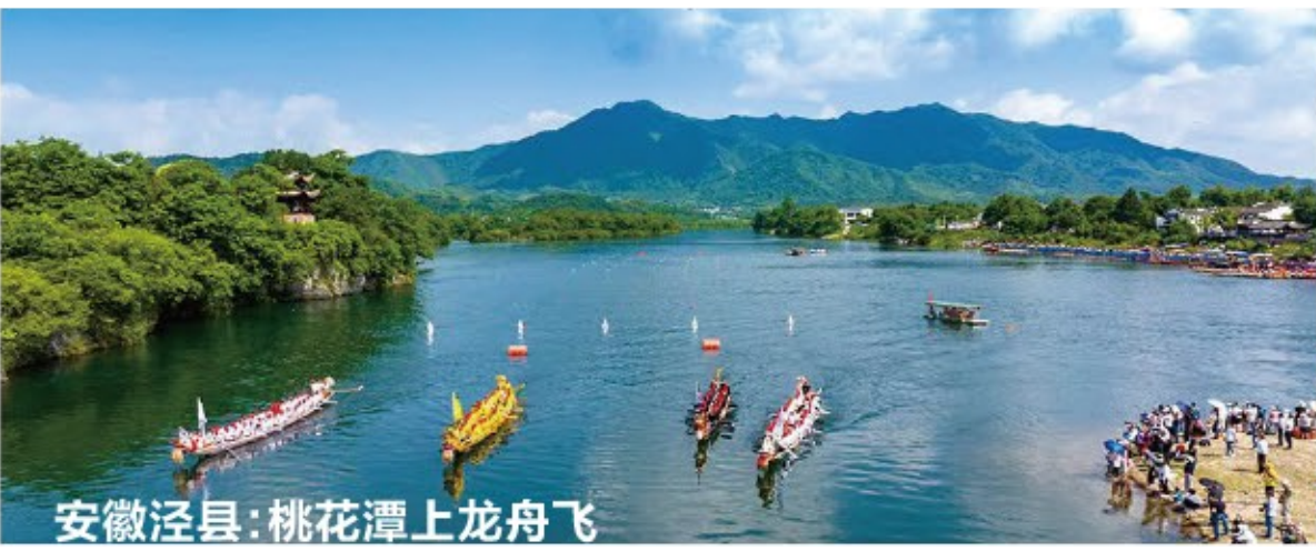
安徽泾县：桃花潭上龙舟飞

录”也正正式揭晓。今年的国际档案日，上海市档案馆发布了《上海市档案馆指南》(新版)和《东方欲晓——新民主主义革命记忆》两本新书。据介绍，从5月24日至6月14日，上海各级各类档案机构积极参与“国际档案日”系列宣传活动。通过举办专题展览、档案发布、“档案开放日”等活动，从档案视角生动展现新中国成立以来，在中国共产党的领导下，上海发展所取得的重大成就，突出展现新时代上海城市的新变化新面貌新气象，展现档案工作在服务推进中国式现代化、助力上海加快建设具有世界影响力的社会主义现代化国际大都市的进程中所发挥的独特作用。