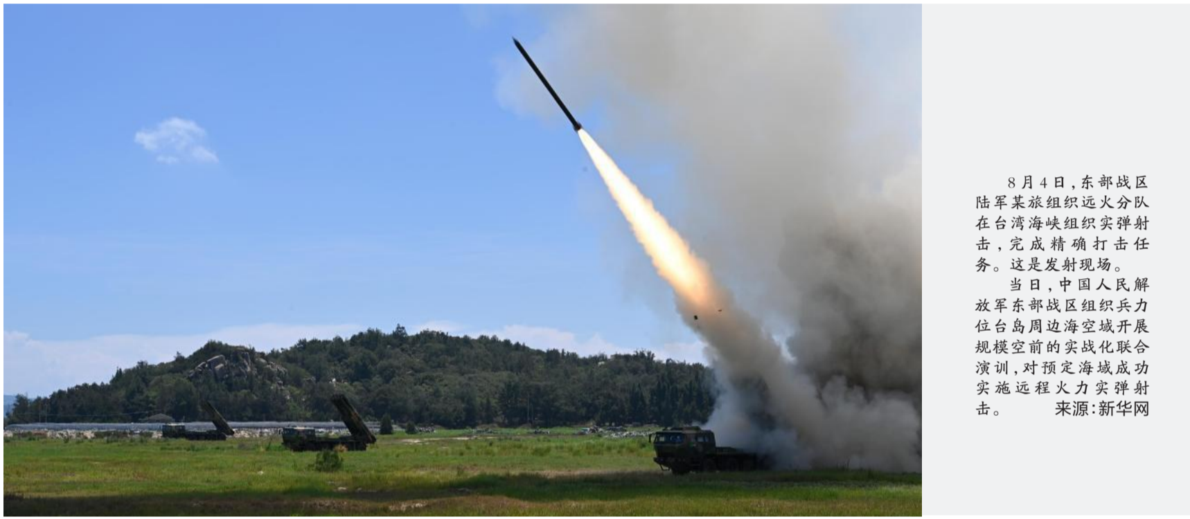
8月4日,东部战区陆军某旅组织远火分队在台湾海峡组织实弹射击,完成精确打击任务。这是发射现场。

美国有线电视新闻网报道说,人们经常批评美国政府对于猴痘疫情的处理方式,一些人曾呼吁拜登政府尽快宣布全国进入公共卫生紧急状态。世卫组织于7月下旬就宣布了猴痘疫情已经构成“国际关注的突发公共卫生事件”。此前,美国的纽约市、旧金山市、加利福尼亚州、伊利诺伊州等地已经宣布因猴痘疫情进入公共卫生紧急状态,以便腾出资金和资源应对疫情。