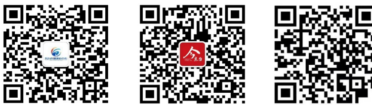
扫一扫,关注东台融媒、今东台微信公众号和今东台APP

使命如炬,重任在肩。让我们鼓足干劲、乘势而上、实干争先,奋力推动高质量发展走在前做示范,以优异成绩向新中国成立75周年献礼!