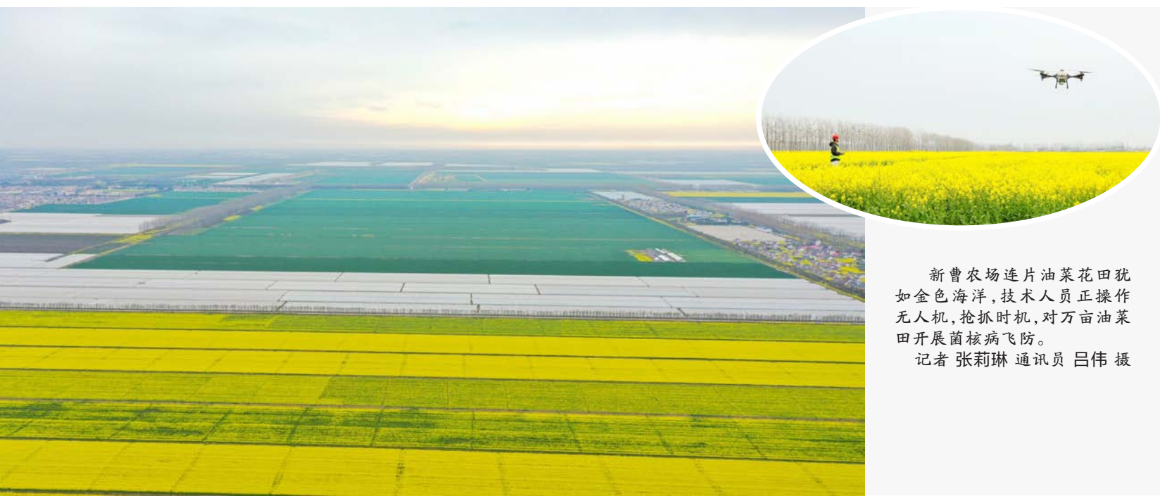
新曹农场连片油菜花田犹如金色海洋，技术人员正操作无人机，抢抓时机，对万亩油菜花田开展菌核病飞防。

学习、作出表率，各基层党组织要担负主体责任，基层党委要对所辖党支部加强全覆盖、全过程指导。注重分层分类，针对不同层级、不同领域的党员干部需求，针对性地做好解读培训，切实增强领导干部政治定力、纪律定力、道德定力、拒腐定力。强化统筹协调，将党纪学习教育与贯彻落实习近平总书记对江苏工作重要讲话、在盐城考察时重要指示精神结合起来，与纵深推进全面从严治党结合起来，与集中整治群众身边的不正之风和腐败问题结合起来，确保学习教育有序有效开展。