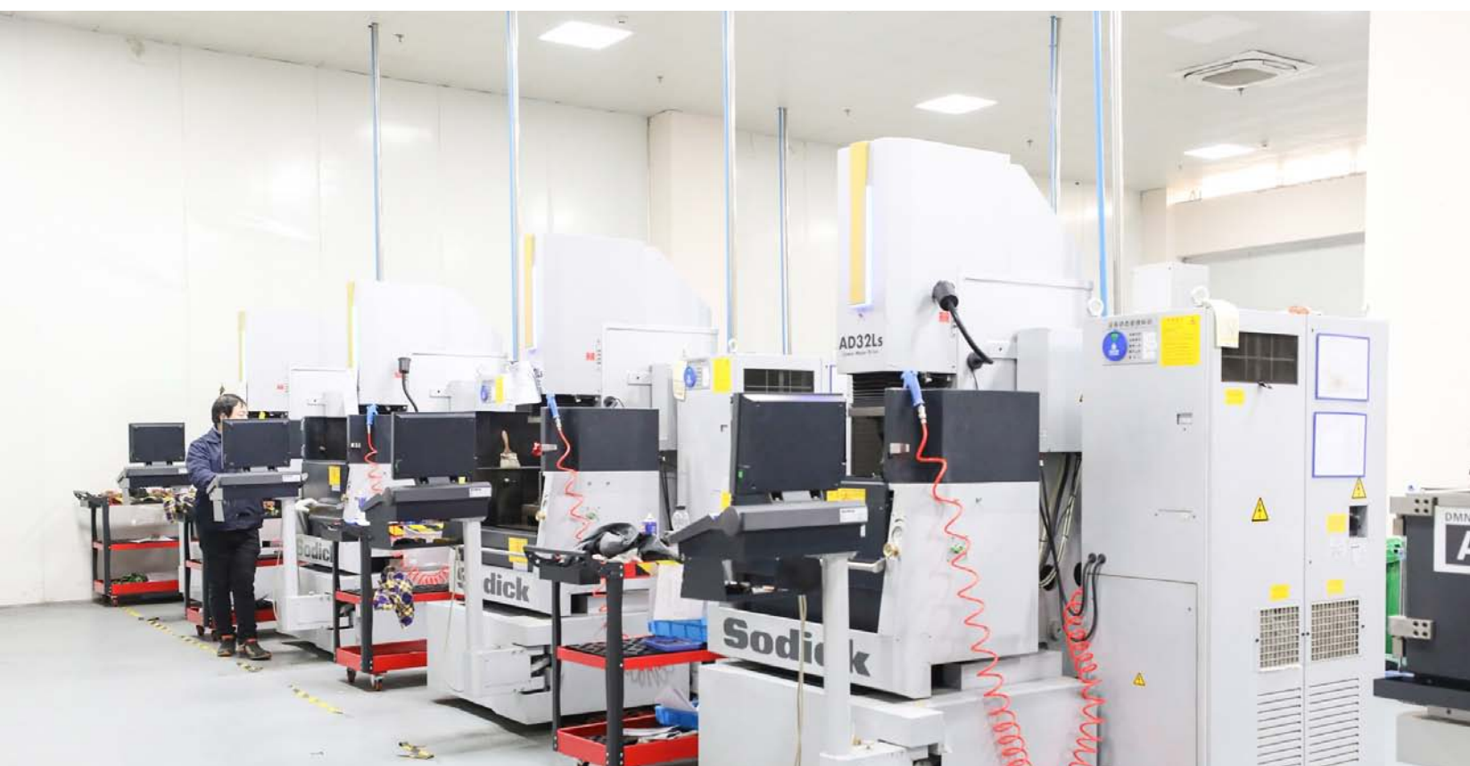
经济开发区徂木精密注重科技智能化发展，抢抓新能源风口，与比亚迪、华为、小鹏等新能源车企均有合作。