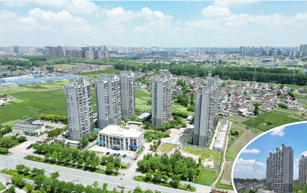
近年来,我市不断加大安置房建设管理力度,高标准完善住房保障体系,让人民群众住得安心舒心。图为已交付使用的蔡六安置区项目,周边环境优美、设施便利,在蓝天白云映照下景美如画。