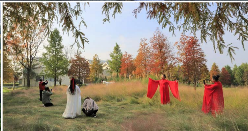
11月21日,黄海国家森林公园三万亩水杉林海五彩斑斓,景美如画,吸引游客前来观光游览。