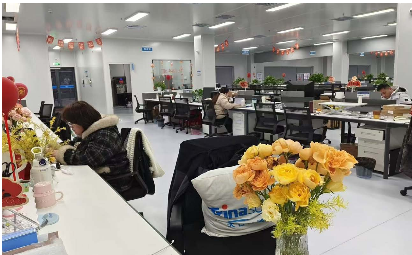
经济开发区天合光能春节期间加班加点，企业为留守职工办公场所营造出温馨节日氛围。