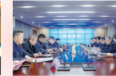
丹阳中专接受江苏省联合职业技术学院认定现场考察