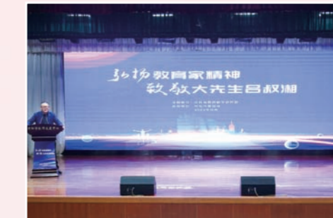
我市承办“弘扬教育家精神,致敬大先生吕叔湘”系列活动