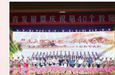
我市举办第40个教师节庆祝大会