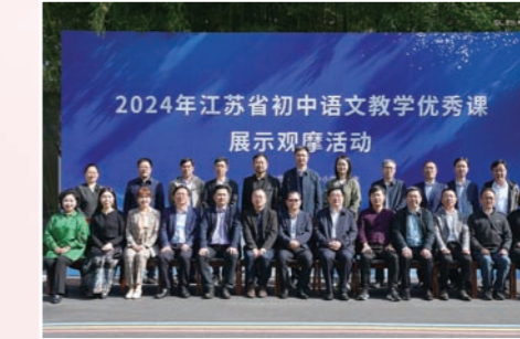
我市承办江苏省初中语文教学优秀课展示观摩活动