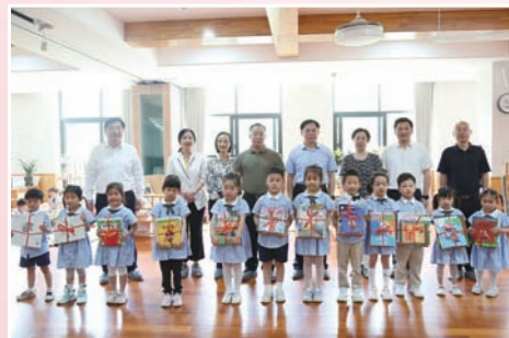
市领导“六一”儿童节走进校园