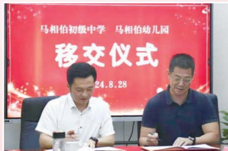
马相伯初级中学(幼儿园)举行移交启用仪式

用实干作答，凭实绩答卷。2024年，在市委、市政府坚强领导下，全市教育系统围绕“打造高品质活力教育丹阳样态”总体目标，凝聚抓落实的思想共识，昂扬向上攀登的奋进姿态，人民群众的教育幸福感更可感、更可见。