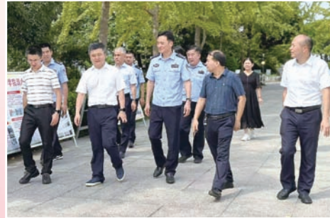
江苏省政法委、公安厅领导来丹阳指导安全工作