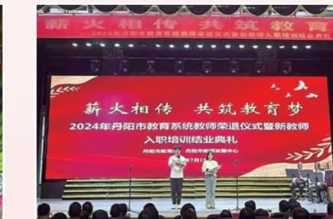
我市举行教师荣退仪式暨新教师入职培训结业典礼