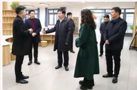
丹阳市人民政府市长宋飞雄调研教育工作