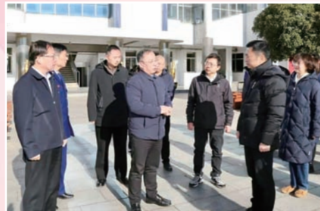
镇江市人大常委会副主任、丹阳市委书记王成明调研我市校园安全工作