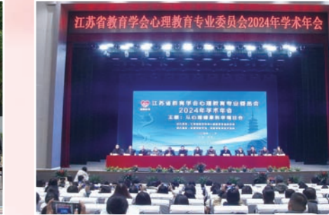
我市承办江苏省教育学会心理教育专业委员会2024年学术年会