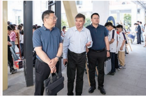
教育部中小学科学教育实验组调研我市科学教育