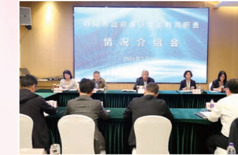
我市顺利通过国家学前教育普及普惠县(市、区)省级实地核查

聚力服务升级，保障支撑更加有力。 优化教育资源配置，启用马相伯初级中学(幼儿园)，极大缓解开发区初中、学前两个学段的入学压力。界牌中学新建教学楼竣工交付，办学条件得到改善。科学应对学龄人口变化新形势，对5个乡镇9所学校进行资源整合。不断扩大“积分制”入学范围，服务外来务工人员随迁子女。筑牢校园安全防线，联合多部门共同制定《丹阳市未成年人保护和预防犯罪工作四项机制》，研制《丹阳市教育系统未成年人保护工作实施细则》。推行“1530”安全教育模式，开展法治副校长进校园等主题活动100余场，制作《丹阳市未成年人保护推荐视频选集》10集。提升为民服务品质，开展食堂专项整治工作，组织进行4轮190次检查，进一步规范食堂财务以及日常管理。职业技能鉴定完成3056人次，社区技能培训完成9600余人次。3个社区教育项目入选省级社区品牌建设项目。