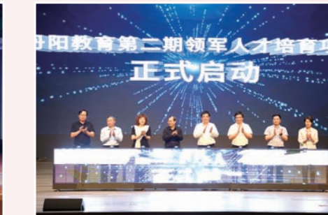
我市举办“三领”工程结项暨第二期领军人才培养项目启动仪式