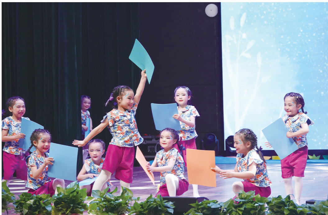
5月10日，滁州市第十三届“小舞台·大文化”系列活动启动仪式暨舞蹈总决赛在滁州市明湖校区科兴楼大礼堂如期举行。定远代表队奋力争先，延续了往届精彩表现，取得了1个一等奖、2个二等奖、3个三等奖的优异成绩。