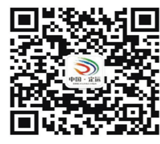
“三色定远”微信公众号