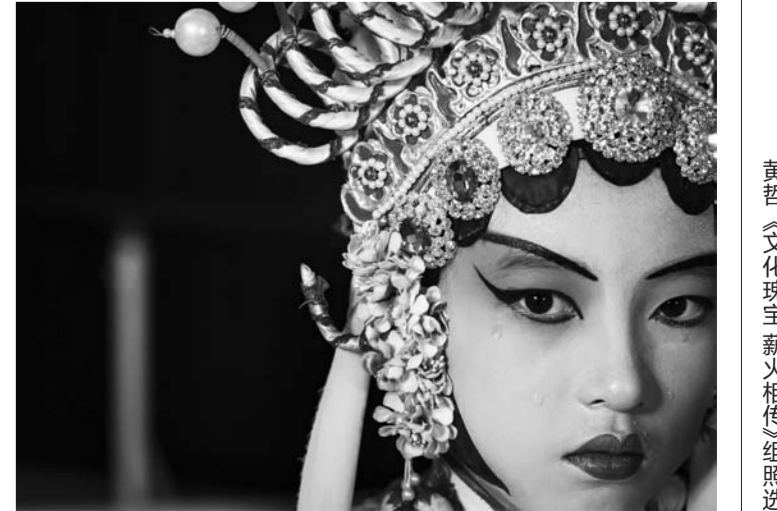
黄哲《文化瑰宝 薪火相传》组照选