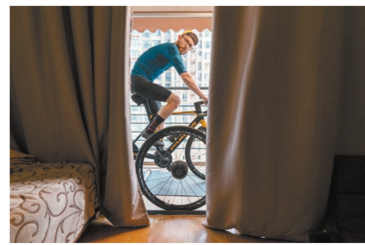
蒋文龙《全中国的家里》组照选