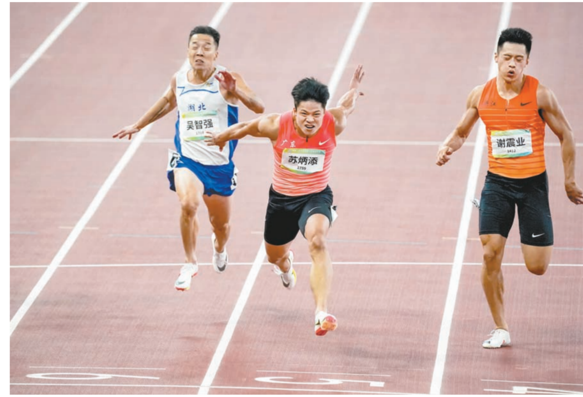
评委会推荐作品: 丁亮《“亚洲飞人”苏炳添中秋夜圆梦》