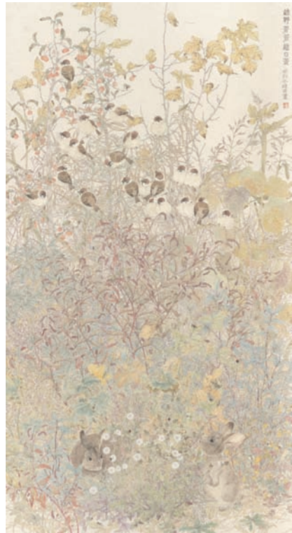
《秋野苍苍秋叶黄》 中国画 费婧苗(江苏)

【编者按】4月7日，第五届“悲鸿精神”中国画、油画展在省现代美术馆开幕，本届展览共收到全国各地来稿2256件，经评委会专家评审，初评入围277件，复评入选141件。这些作品题材新颖，技艺精湛，较好地呈现了新时代美术创作的风貌与水准。现选登20件优秀作品，与读者共赏。