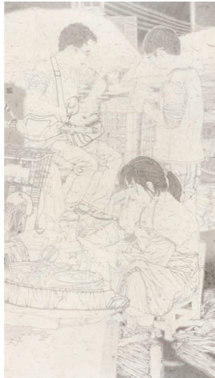
《民间故事·早市口》中国画 梅顺(江苏)