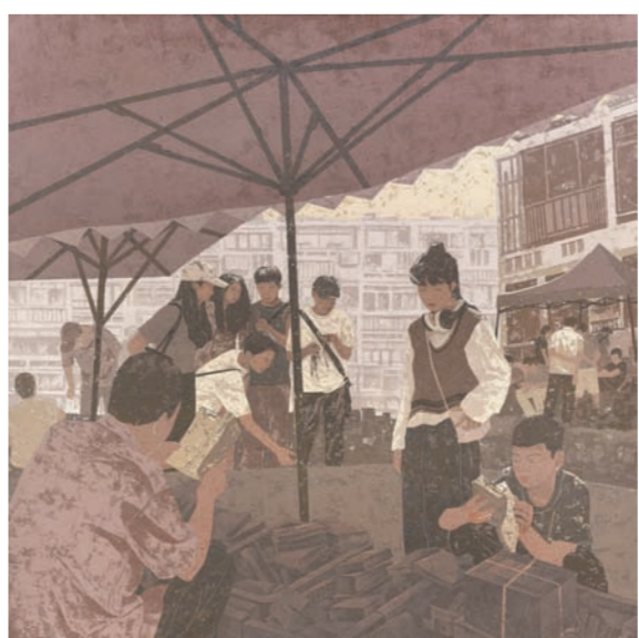
《不负春光好读书8》油画 周雪萍(广西)