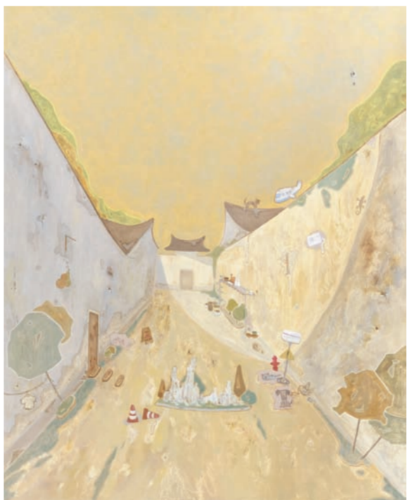
《阳光正好》油画 杨丹(江苏)