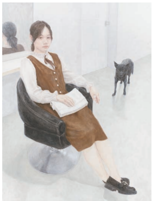
《等候》油画 延雨泽(江苏)