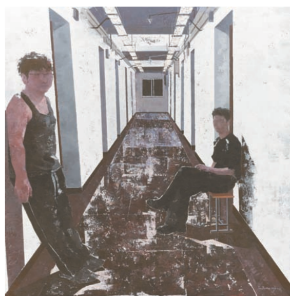
《走廊 NO.2》油画 顾佳伟(陕西)