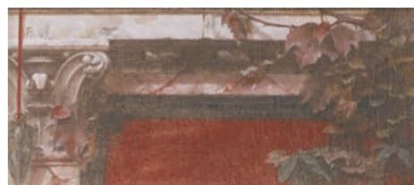
《红色的线》油画 范鑫光(湖北)