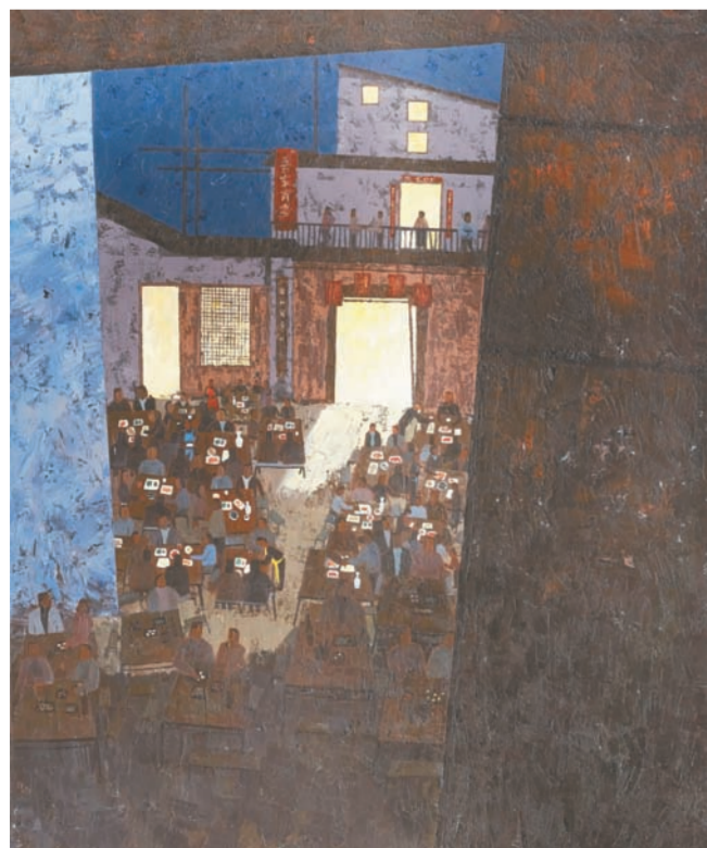
《家宴 NO.4》油画 陈尹(广西)