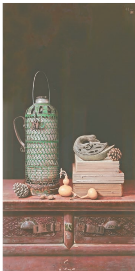
《追忆》油画 周玺(山东)