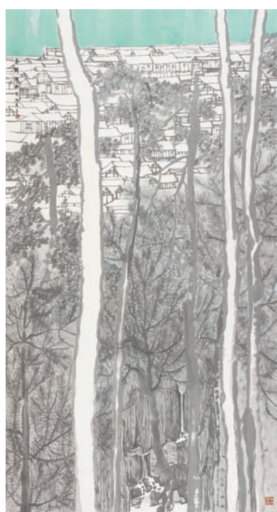
《湘西春早》中国画 蒋秀召(湖南)