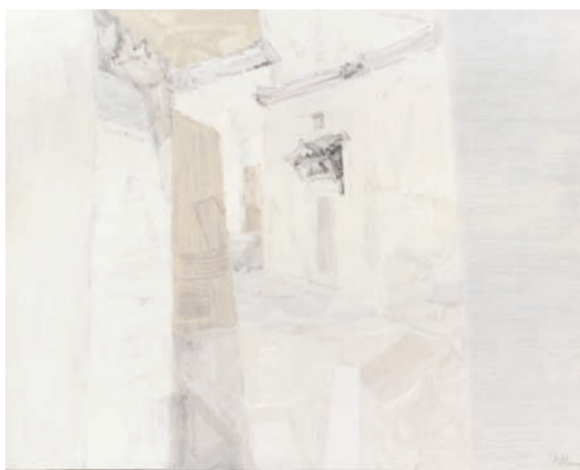
《圣光·畔上人家4》油画 马新(吉林)