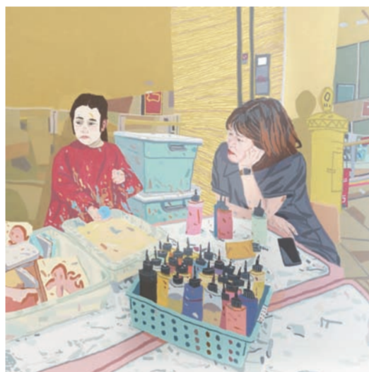
《母与子》油画 魏巍(江苏)