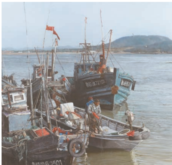
《鲁崂渔2》油画 陈帅安(江苏)