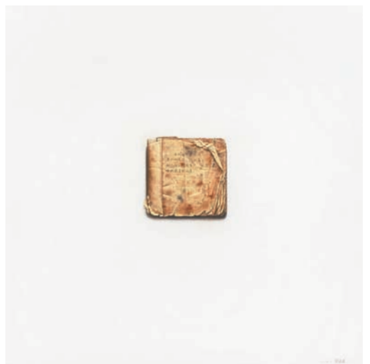
《第一篇作文》油画 刘道远(湖北)