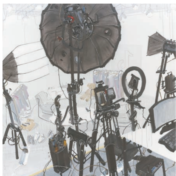
《新时代风景之聚光灯下》油画 钟竞翔(广西)