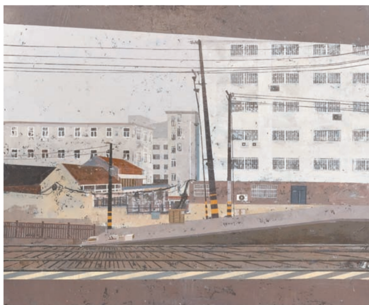
《记忆中的城》油画 吴天琪(山东)