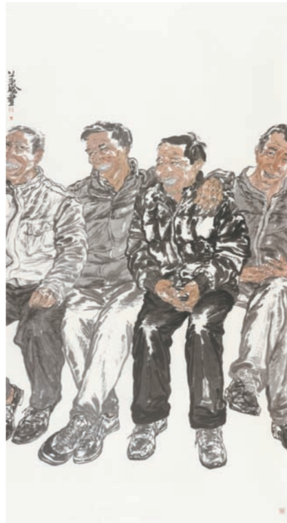
《回家路上》中国画 王梦晗(江苏)