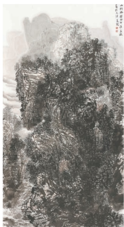
《山行幽谷》中国画 侯美凝(河南)