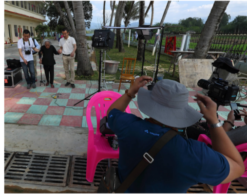
《揭秘日军“慰安妇”暴行》摄制组采访幸存者