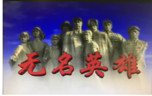
《无名英雄》获全国精神文明建设“五个一”工程奖