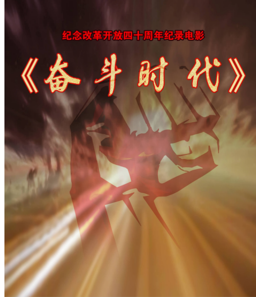
《奋斗时代》获32届中国电影金鸡奖最佳纪录片奖