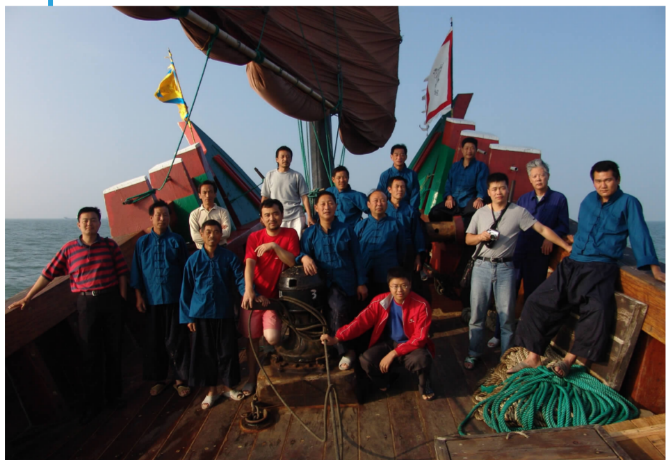
《郑和下西洋》摄制组与仿古木船水手们在大海中颠簸半个月