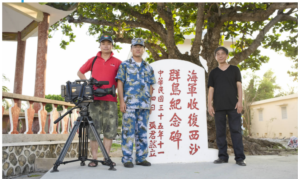
《南海纪行》摄制组在南海永兴岛与守岛军人合影