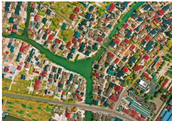
王瑞富 鸟瞰张弓 摄影