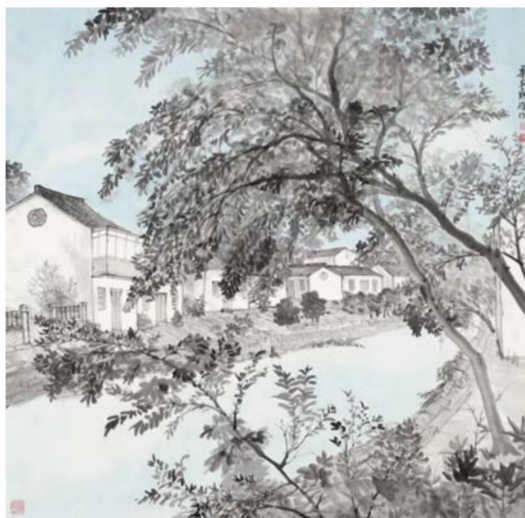
毕宝祥 走进小康村-1 中国画