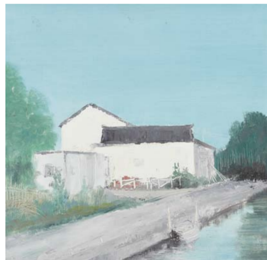
郭丽 小康村三 油画