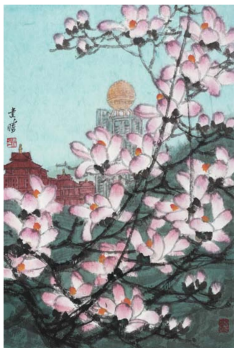
高建胜 春暖华西 中国画