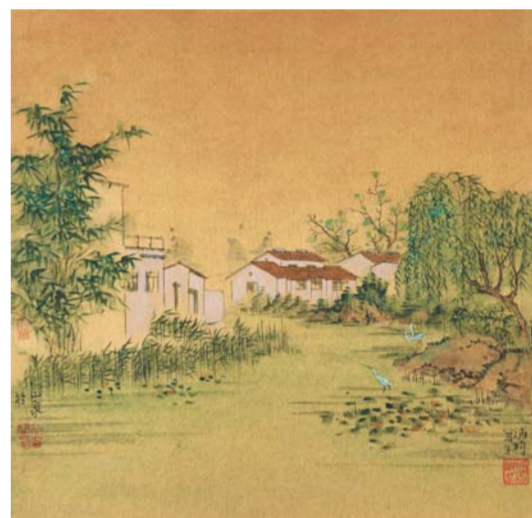
浦均 长江村 中国画