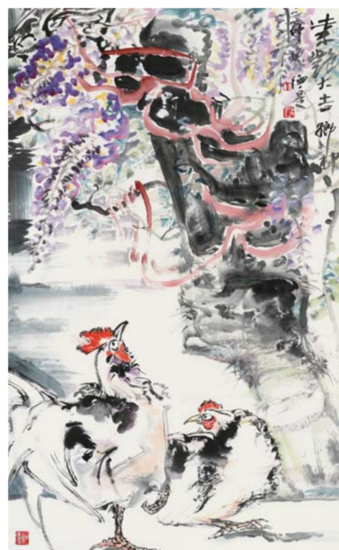
高德星 紫艳大吉——乡村印象 中国画