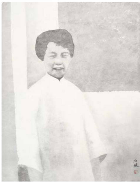
石晓 费达生 中国画