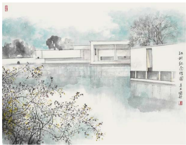
陈国欢 江村纪念馆 中国画