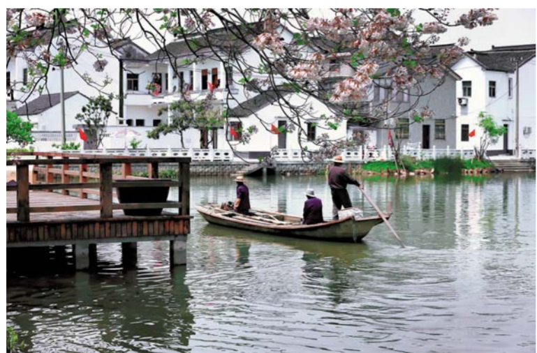
吉龙生 水乡人家 摄影