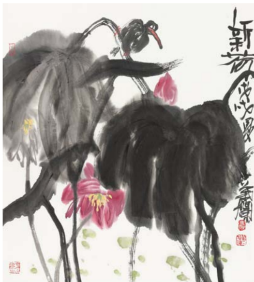
叶烂 新荷 花鸟画