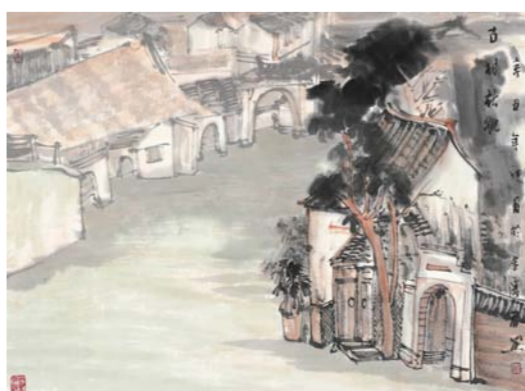
赵震 古村新貌 中国画