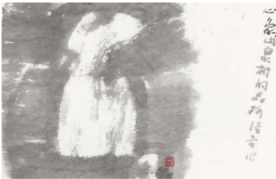
赵绪成 心象·山泉村的品格 中国画