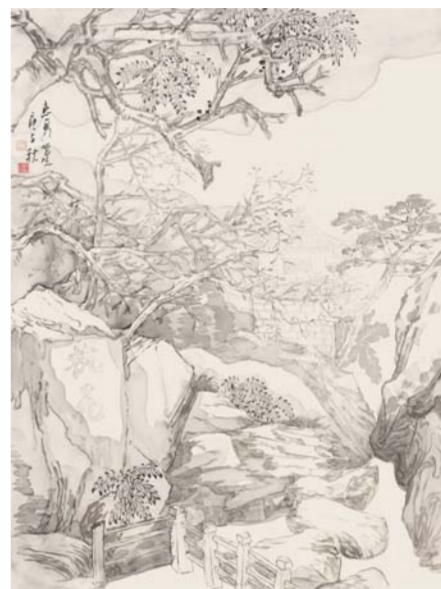
徐惠泉 宜兴玉女潭写生(一) 中国画