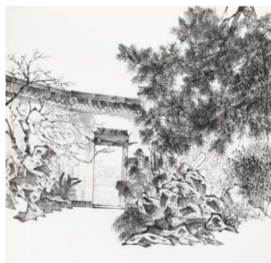
凌昕 小康村园景系列之一 中国画