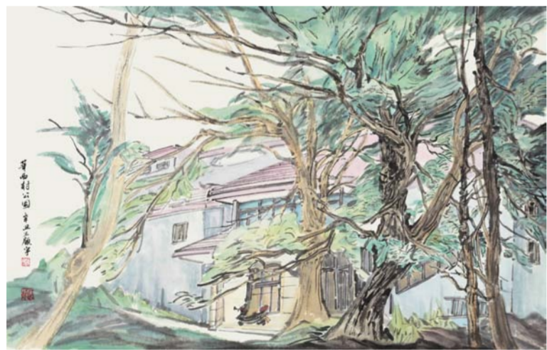
王顾宇 华西村公园 中国画