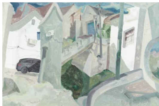
厉业亨 小康村写生之一 油画