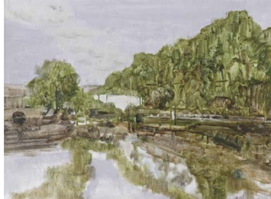
刘维桑 江村绿荫 油画