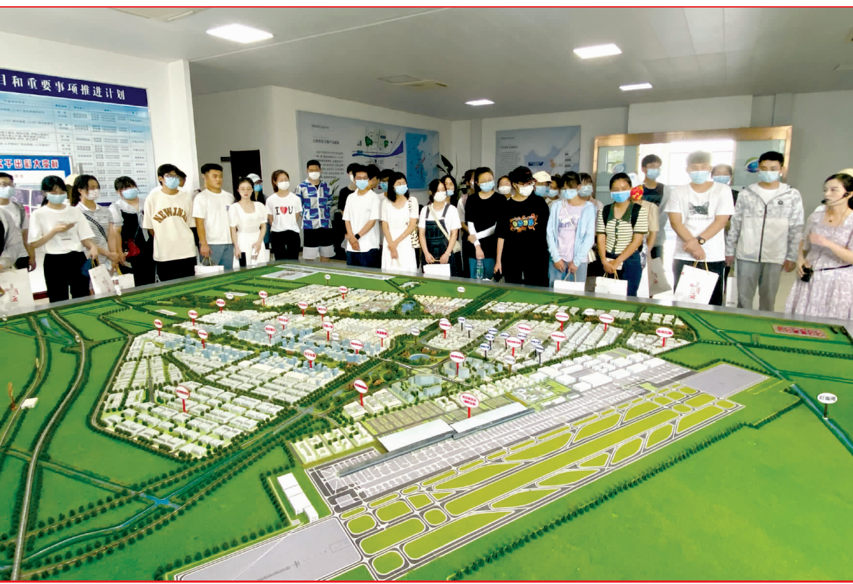
12日上午,由县委人才办、县人力资源社会保障局组织开展的“千名学子看灌云”暑假系列活动走进县空港产业园等重点园区和企业,通过现场观摩,鼓励灌云籍在外大学生毕业后返乡投身创新创业创新热潮,服务家乡经济发展。