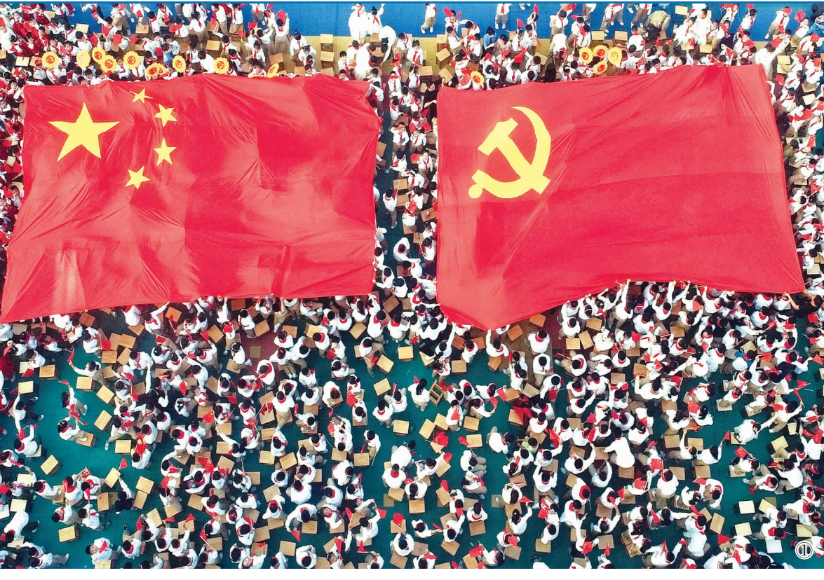
国庆节前夕,我县举行丰富多彩的活动表达听党话、感党恩、跟党走信心和迎接二十大胜利召开的喜悦心情。图1为9月28日县朝阳实验小学学生与国旗、党旗合影;图2为近日伊山中心小学举行“喜迎二十大、歌声颂党恩”校园合唱比赛;图3为9月30日县实验中学“喜迎二十大、筑梦向未来”迎国庆歌咏比赛现场;图4为近日我县“喜迎二十大、法典齐相伴”普法宣传教育乡村行走进下庄镇。