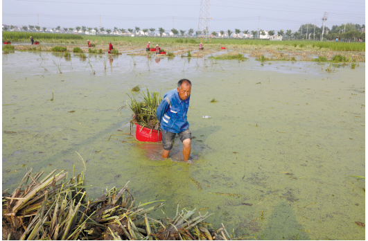
图为近日伊山镇向阳村村民忙着采收茭白苗销往周边镇村。据了解,向阳村培育的茭白苗为双季茭白,种植效益较高。

县民政局自2021年起,已经连续3年依托儿童“关爱之家”,设立“爱心暑托班”,针对不同年龄段、不同年龄段儿童的需求,整合多方资源、精心策划,开设了思想引领、法治教育、心理呵护、安全自护、兴趣拓展、劳动实践、角色体验等七大类课程,为孩子提供了安全、快乐、充实的暑期学习平台。