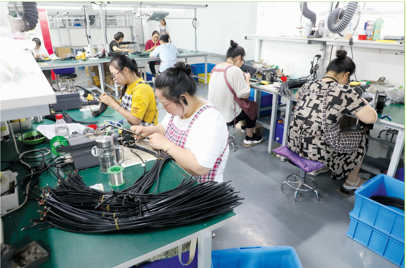
连日来,连云港玉电智能科技有限公司各条生产线高速运转,全力赶制订单。该公司位于东王集镇工业集中区内,主要产品为汽车线束、防水线束、医疗线束、工业线束、电梯线束及电脑周边配套线束、插件与线材等,提供就业岗位60余个。