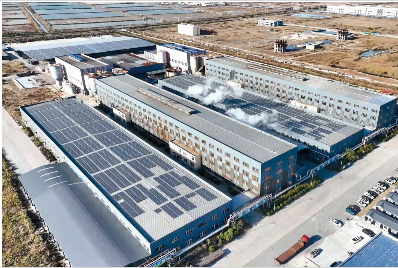
江苏玖森纸业有限公司位于县临港产业区内,主要生产销售工业包装用纸。现有2条先进高强瓦楞纸生产线,年产能达35万吨,销售额超10亿元。该公司以废纸为原料,致力于建设资源再生利用、发展循环经济的环保型示范企业。