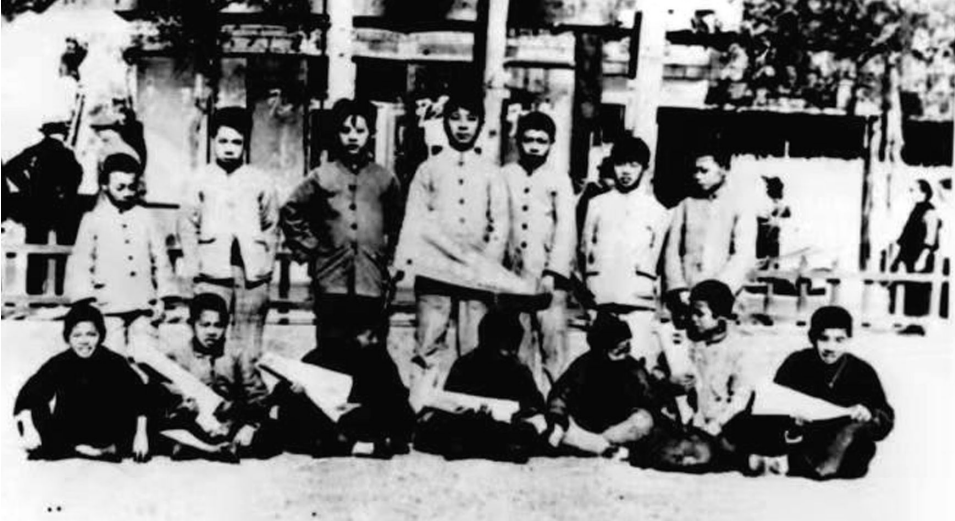
与上海报童在静安寺合影