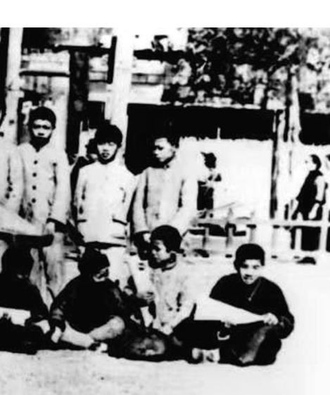
与上海报童在静安寺合影

陶行知先生创办新安小学,关心支持新安旅行团的活动, 非任何政治的阶级的目的,他是一个真正的救国救民的教育家。他作为一个知识分子,“捧着一颗心来,不带半根草去”,以