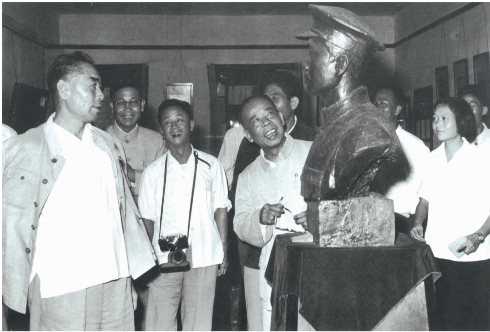
1961年9月18日，周恩来参观八一一起义纪念馆

1927年8月1日，周恩来、贺龙、叶挺、朱德、刘伯承等领导2万余人的革命武装，举行南昌起义，从此揭开了中国共产党领导武装斗争的历史。1933年6月30日，中央革命军事委员会发布《关于决定“八一”为中国工农红军成立纪念日》的命令。“文革”初期，有人提出要将建军节日期改为9月9日，即秋收起义的时间，毛泽东坚决反对。1967年，毛泽东对解放军代理总参谋长杨成武说：“‘八一’不能改，这是很重要的一天，打响了反对国民党反动派的第一枪。”并要杨成武将这段话的内容向周恩来汇报。1969年6月28日至30日，毛泽东在湖南、江西与当地党政军负责人的谈话中，再次肯定了南昌起义的历史作用和周恩来等人的历史功绩。