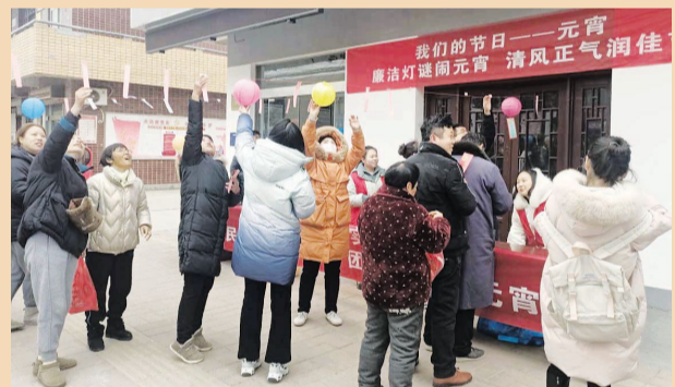
2月3日，淮城镇文明实践所开展“猜灯谜庆元宵”活动，吸引群众参加。陆璇 李宣璋 摄