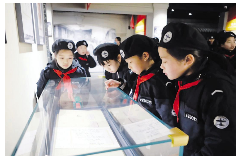
2月3日，江苏少年警校2023冬季研学营85名学员来我区开展“践行志愿服务 传扬崇警新风”活动。学员们参观了区公安分局情报指挥中心，走进新安旅行社历史纪念馆，重温了“新旅”17年的辉煌历程。

争当“监督员”，让振兴发展稳步推进。该镇各级人大代表广泛开展调研、视察等活动，切实发挥监督职能，推动乡村振兴有关政策措施落地落实。代表们坚持实事求是，走好群众路线，对发现的问题毫不含糊，立即督促责任单位及责任人整改落实。去年先后组织开展以乡村振兴为主题的调研2次、整改问题3件、调解矛盾5起，为推动全镇各项事业健康稳步发展发挥了重要作用。