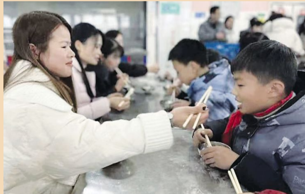
2月5日，淮安新教育学校开展“红红火火闹元宵，开开心心迎新年”活动。报到的学生和家长们参加了“猜灯谜”、“亲子吃汤圆”等活动，度过了一个快乐温馨的元宵佳节。

该社区区域内内街巷、文保景点较多，现有文明城市点位36个。该社区重点加强后街背巷的管理，登门入户，广泛宣传，提高居民的文明素养和爱护环境的参与度。通过景区和社区联动的模式，加大区域内水系的整治力度，按照门前“三包”规定加强对沿街店铺的管理，落实文明城市建设各项措施，对标找差，定点定人，不留死角，形成社区千群人人争做靓点古镇的美容师热潮。