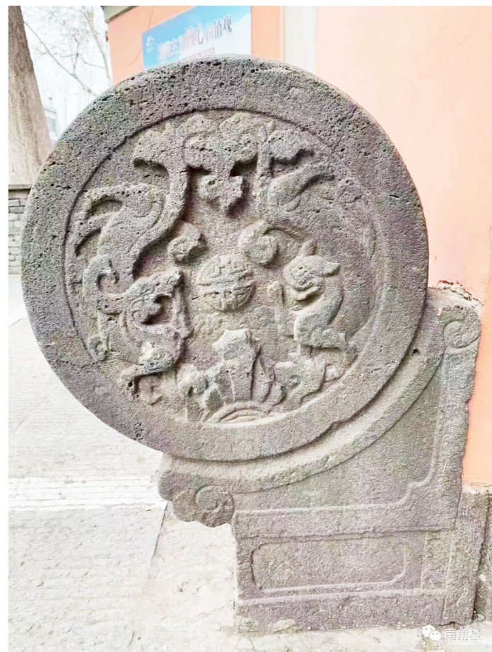
图为文通塔苑南大门前两侧的石墩

淮安古建筑上的龙文化只是中华龙文化的一部分。从古至今,淮安先人们秉承着龙所蕴含的自信进取精神,用非凡的艺术创造力,精湛的手艺为我们留下了宝贵的财富,我们要努力传承、弘扬好龙的文化。