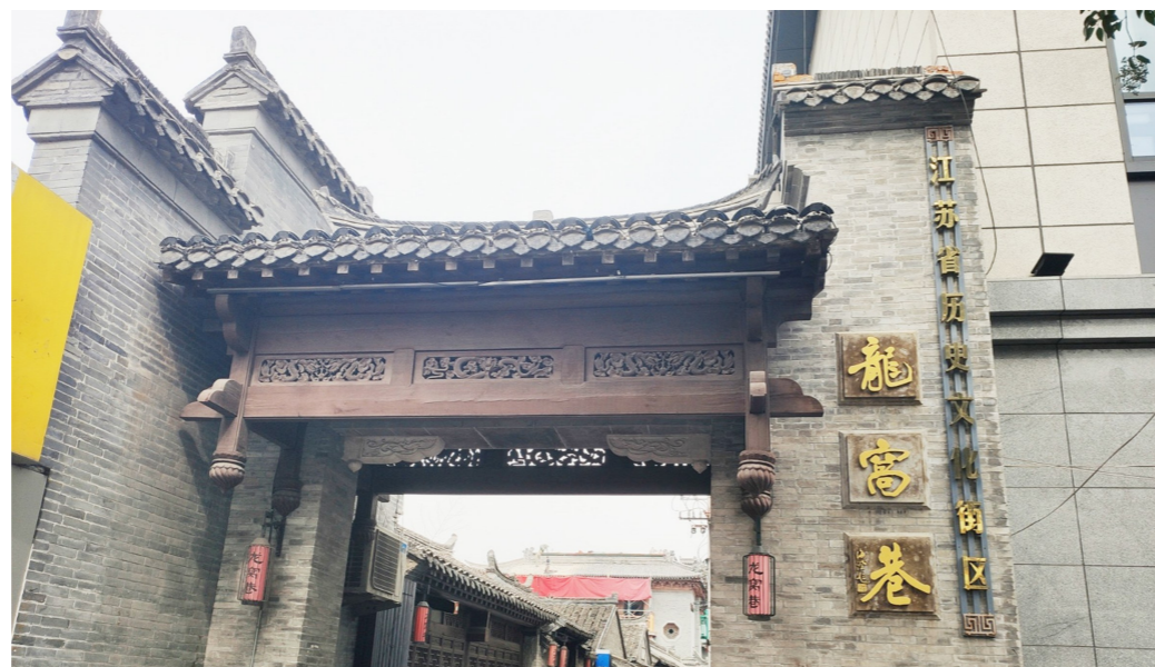
龙宫巷墙上龙字图案

龙窝巷位于上坡街与骑马巷之间,是淮安古城中心重要的南北向的巷子。正德《淮安府志》卷五记载道:“龙窝巷,在大圣桥南,相传甘泉井有龙出没,故名。”可以看出,龙窝巷得名应该来源于这条通向大海或者淮河的、有龙出没的“甘泉井”。而在淮安民间,龙窝巷的得名还有两种说法:一是认为宋太祖赵匡胤在后周时打下淮安城后,曾下榻此巷,因而得名;还有一种说法认为是龙窝巷因为曾挖出一窝蛇而得名。这些得名的种种说法,足以证明这条巷子的传奇之处。现在的龙窝巷是江苏省第一批历史文化街区之一,巷内建筑大多保留了古色古香的原始风貌,青砖小瓦,木门飞檐,处处都彰显着历史的风韵和气息。