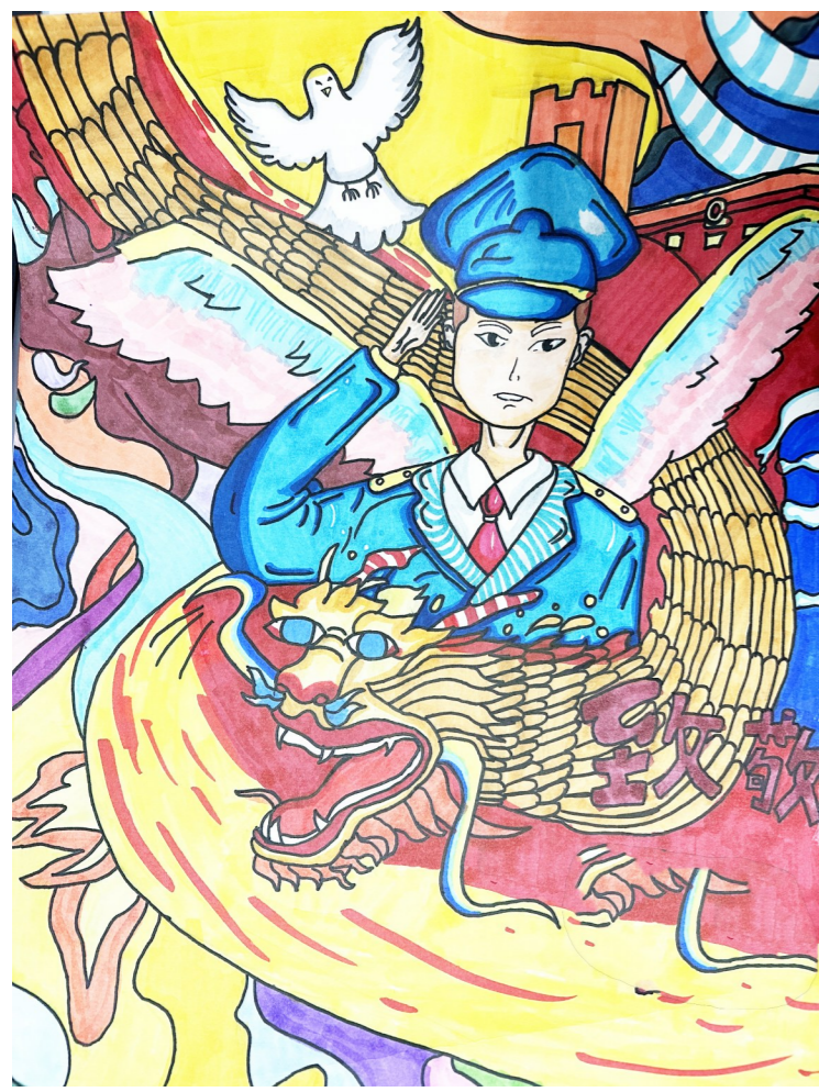
致敬 淮安经济开发区实验小学三(4)班 史河萌 作

“恩来星”小记者 以育人为核心价值追求 填补学校社会教育、实践教育短板 全年百余场社会实践公益活动 让孩子开眼界长见识,锻炼写作、表达等综合能力