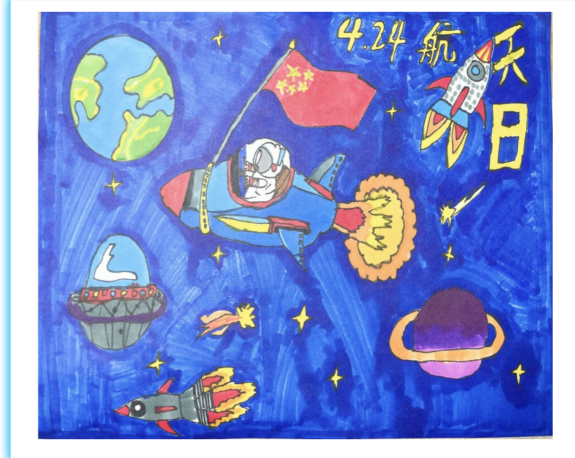
中国航天日 周恩来红军小学五(21)班 陈冠羽 作