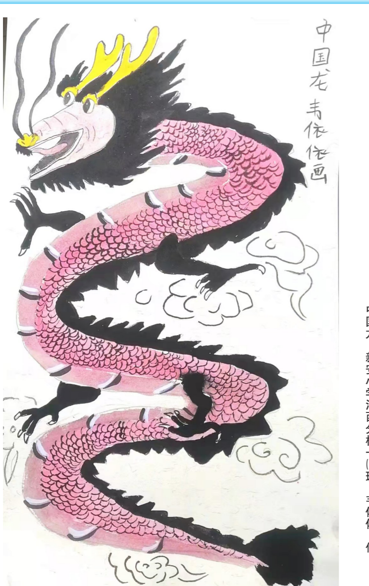
中国龙 新安小学河西分校一(2)班 韦依依 作