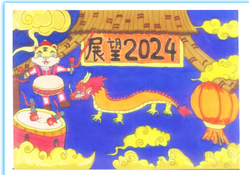
展望2024 新安小学河西分校五(4)班 严诗童 作