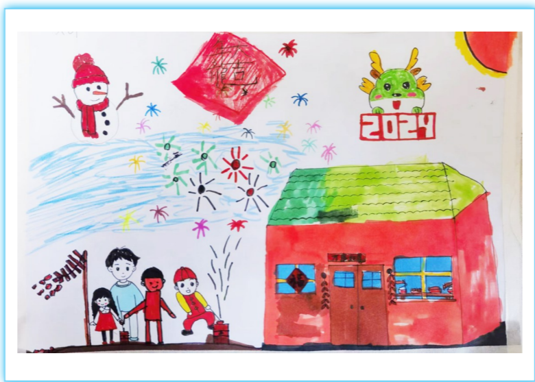
龙年大吉 新安小学本部二(7)班 金光灿 作