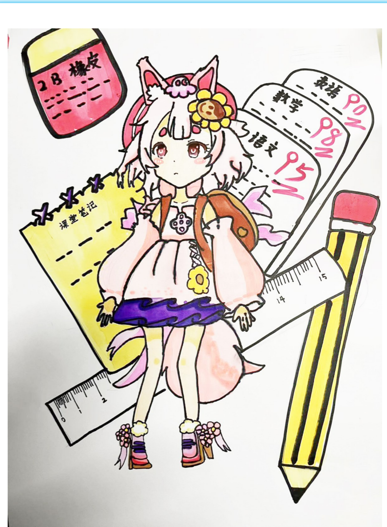
动漫女孩 淮安经济开发区实验小学三(8)班 陈佳伶