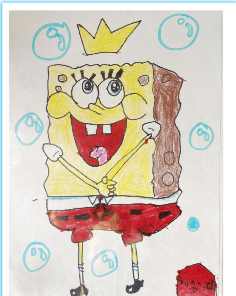
海绵宝宝的欢乐时光 周恩来红军小学四(14)班 刘梦涵