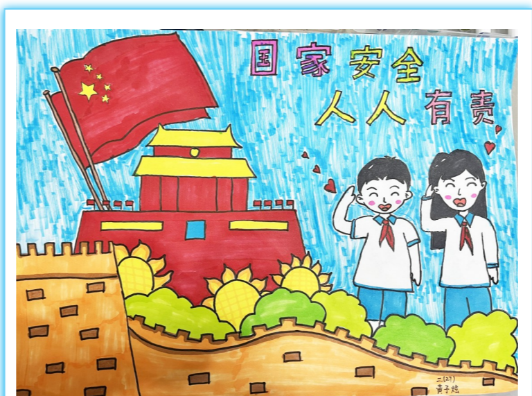
国家安全 人人有责 周恩来红军小学二(27)班 黄子炫