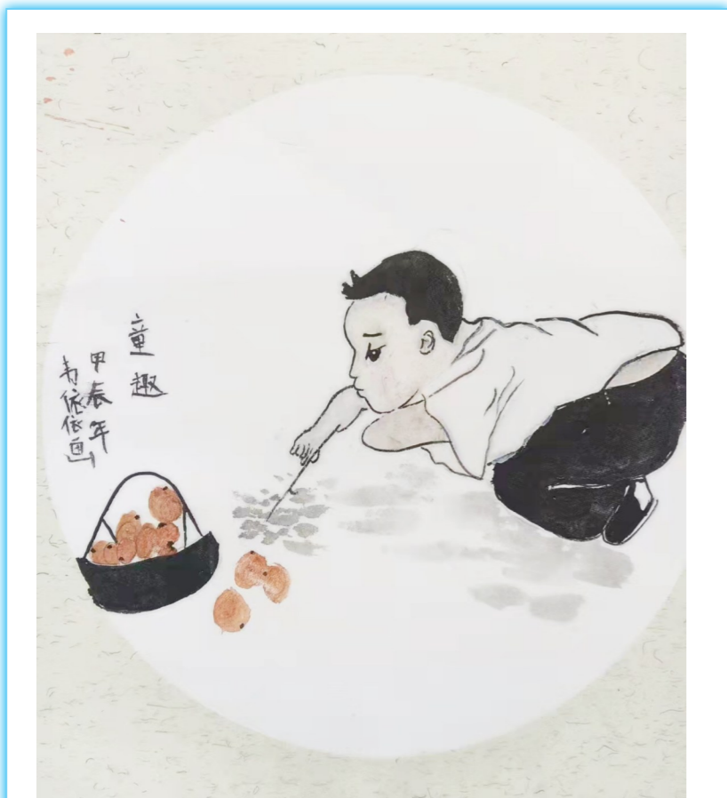
童趣 新安小学河西分校一(2)班 韦依依