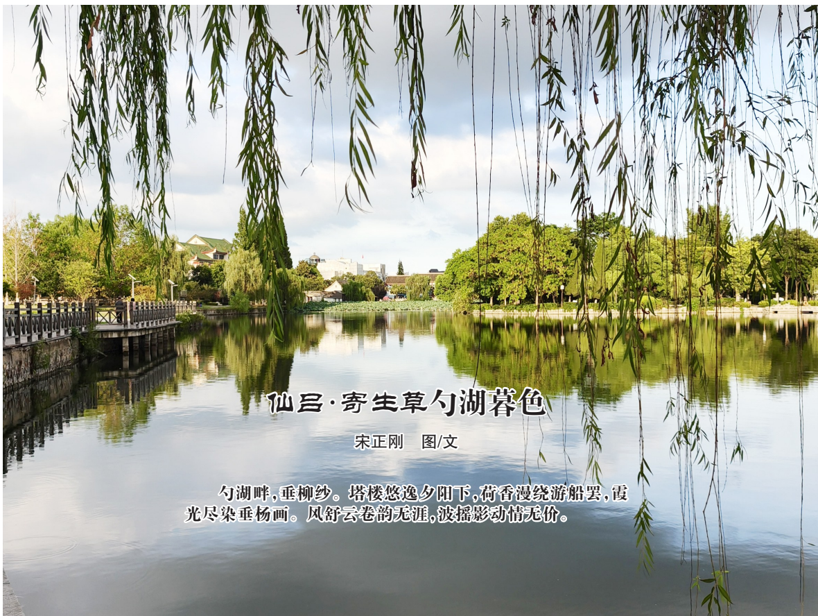
仙居·寄生草勺湖暮色

老人有点腼腆地说:“我想回家给我孙子读书听,我没上过几天学,好多字都不认识呢,闲着的时候,我就让在楼下玩的孩子教我认字,我在能磕磕绊绊地读下一篇文章了。”说着,向三轮车走去。目光望向老人,我和女儿不约而同地对他伸出了大拇指。