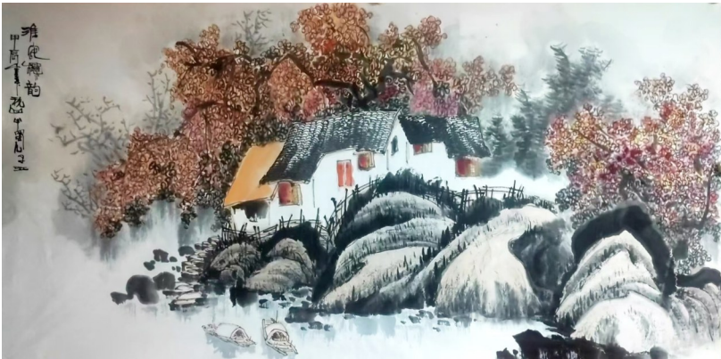
淮安秋韵 林祥荣 作

秋原秋野昌民意，秋实秋华傲苍穹。 秋运秋航腾四海，秋情秋志漾西东。 秋灵秋韵红尘醉，秋策秋谋赤子忠。 秋壮时轮尝夙愿，秋旋歌舞伴谐风。 秋怀秋梦心田美，秋彩秋光气志宏。 秋赞乡村强富路，秋逢时代见新容。 秋乡景亮农家乐，盛世之秋灿彩虹。