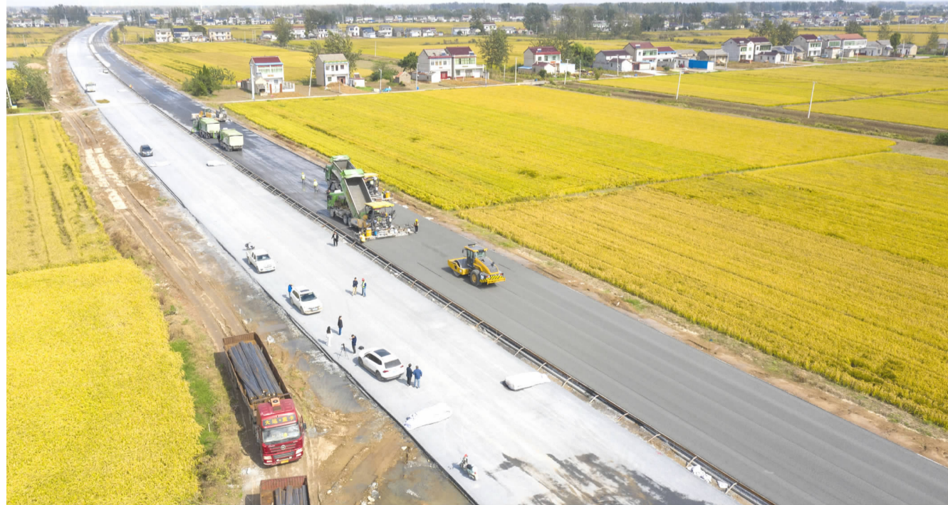
进入四季度，264省道淮安段紧盯路面施工不放松，工程建设者抢抓晴好天气，争分夺秒忙建设，力争项目按时竣工。目前路面水稳层施工进入攻坚阶段，项目组织了4套水稳施工班组在全线进行平行流水作业，计划年内完成路面水稳层的85%，11月份完成沥青青层施工，年内完成沥青青工程的10%。

此次研修班主题鲜明、内容丰富、干货满满，既有政治高度，又有理论深度，更有实务广度，为全省宣传思想文化领域的青年人才带来一次思政之旅和一场精神盛宴。大家表示，将以此次培训为契机，进一步拓宽视野、理清思路、加强学习、创新举措，自觉把习近平文化思想贯彻落实到宣传思想文化工作各方面全过程，在新的历史起点上勇担新的文化使命，以新气象新作为推动宣传思想文化工作高质量发展，为全面建设社会主义现代化国家、全面推进中华民族伟大复兴提供坚强思想保证、强大精神力量、有利文化条件。