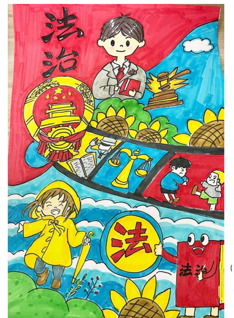
法治 周恩来红军小学四(16)班 孙恩熙 作