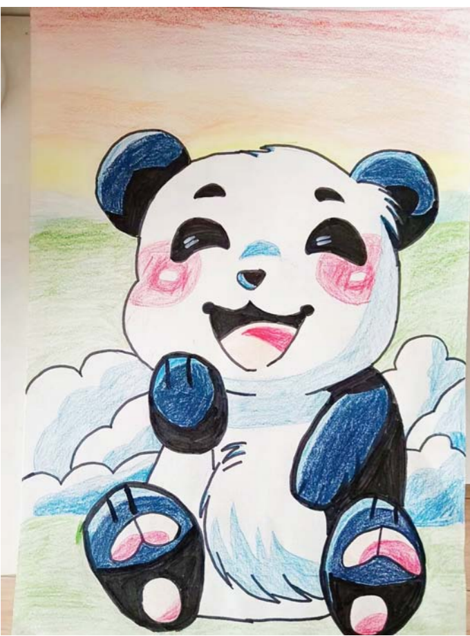
快乐时光 周恩来红军小学四(19)班 吕梓彤 作