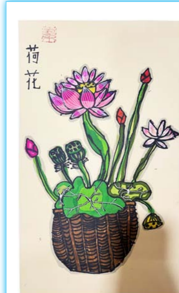
晚秋荷语 刘宸汐 作 新安小学新区分校一(7)班