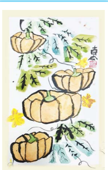
南瓜小聚会 汤瑾哲 作 周恩来红军小学(6)班