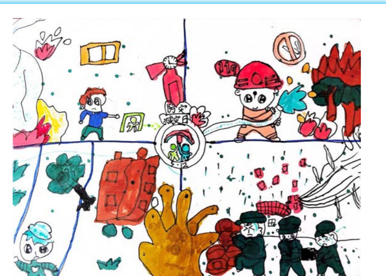
防灾减灾日 关天培小学(4)班 周伊朵 作