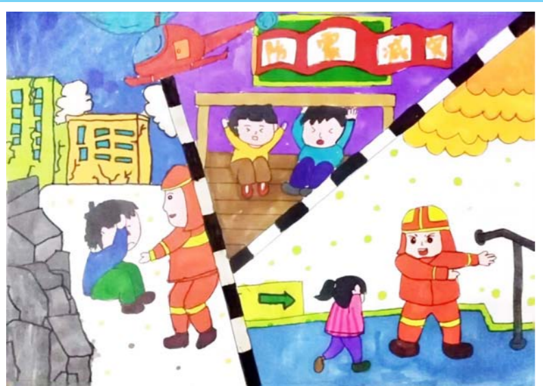
防震减灾 楚州实验小学(8)班 杨语汐 作

秋风送爽,我们迎来了充满活力的11月。在这个收获的季节里,小记者们不仅在写作课上大展身手,更是在实践活动中收获满满。从污水处理厂的奇妙之旅,到民防馆的科普体验,再到对喜爱的玩偶动物的深情描绘,他们的足迹记录了成长的点点滴滴。我们期待更多小记者们的优秀作品,能够在我们的平台上绽放光彩。